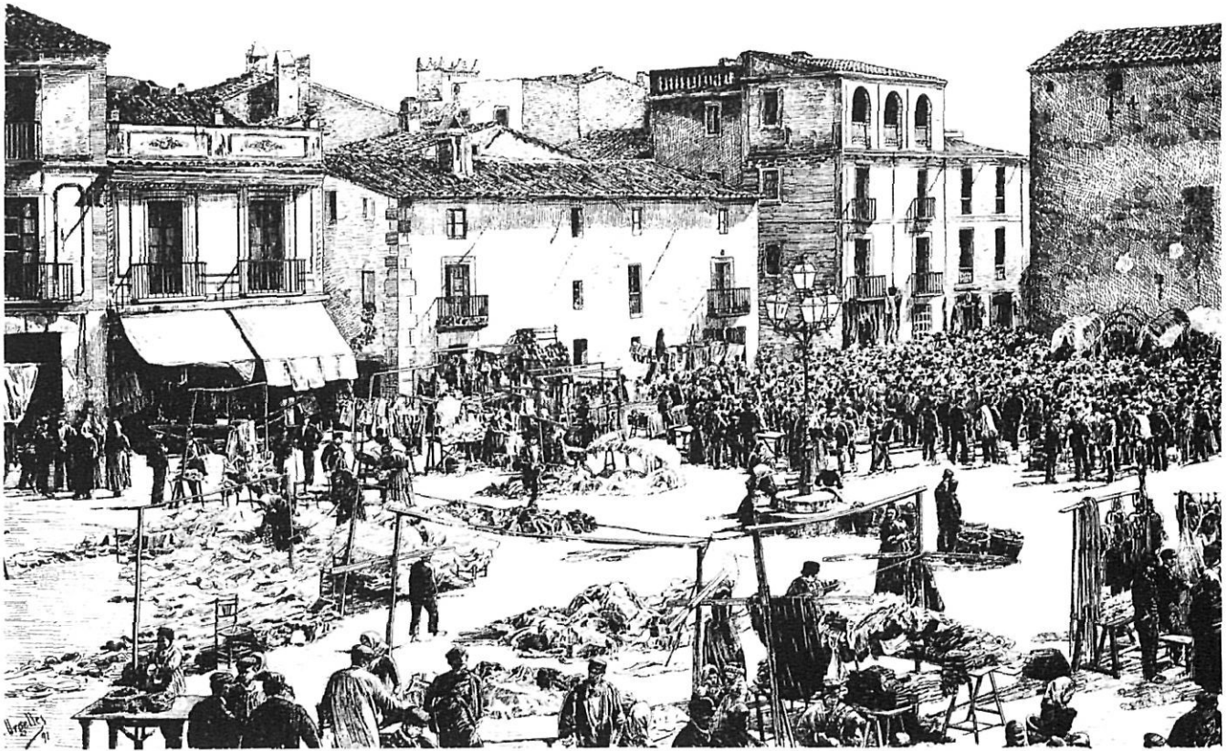
El mercat de Santa Coloma de Farners, segons un gravat antic.

Els dies de mercat i fira, els venedors havien de pagar al municipi el «dret de terratge». A més, les autoritats podien facilitar als comerciants que no en tinguessin, taules per exposar les mercaderies. Els habitants d'Hostalric tenien una taula franca, així com tots els sabaters i esclopers. L'any 1815, amb l'arrendament de «lo emolument dit de las taules», s'obtingueren 53 lliures, 7 sous i 4 diners.