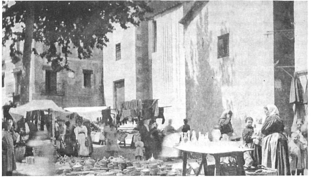
Una vella imatge del mercat d'Arbúcies.