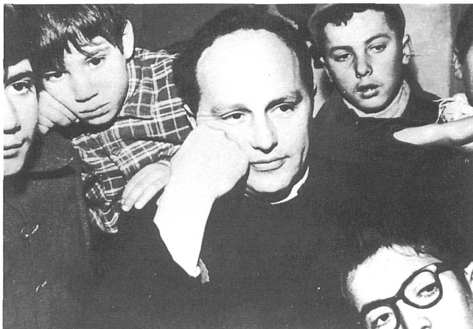
Lorenzo Milani amb els nois de Barbiana.

Carta a una mestra és un «llibre negre de l'ensenyament» i fa una crítica ferotge i crua de l'escola tradicional, de «l'escola oficial que fa els nois arribistes a dotze anys» i que fa «que