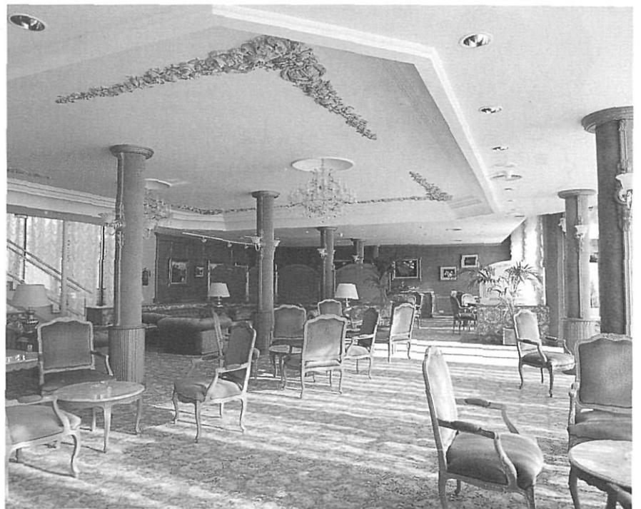
L'hotel Riu, darrer equipament turístic de la Garrotxa.

Altres modalitats de turisme que es donen a la Garrotxa són el turisme de segona residència i el de l'acampada lliure. El primer ha anat adquirint importància en els darrers anys.