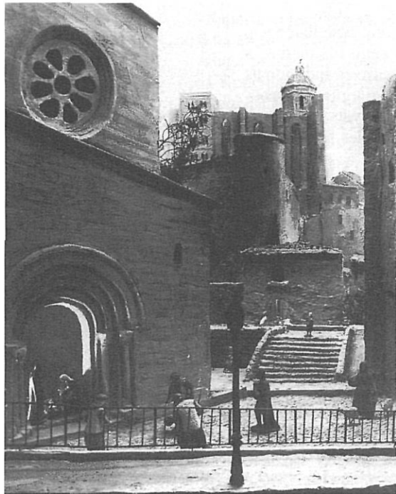
Pessebres amb paisatges familiars: a sota, Girona; a la dreta, Hostalets d'en Bas.

pensat en el seu dia i llavors han quedat en no res. Una absència notable, imperdonable, ha estat la d'unes aportacions bibliogràfiques que servissin de punt de referència d'aquest