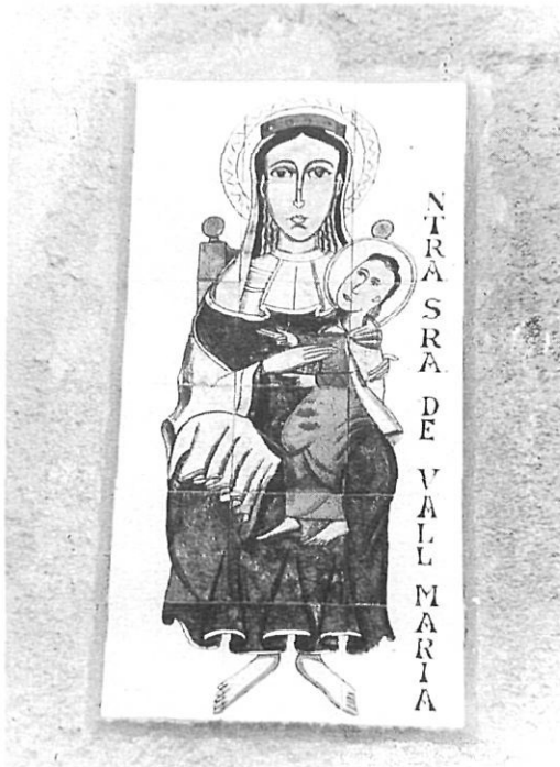
Majòlica que testimonia el rastre històric de Valldemaria.

no calia que li fessin. I no li van fer, en efecte, però li pregaren que acceptés un parell de «fuentes de dulces». A partir, d'aquí, tots els bisbes foren obsequiats de la mateixa manera: amb dolços. Aquests dolços eren, ni més ni menys, diferents confitures en l'elaboració de les quals les monges de Cadins posseïen una habilitat particular. La fama de les confitures de les religioses del Mercadal es va estendre per tot l'àmbit ciutadà i el seu prestigi fou reconegut arreu. En el moment d'esclatar la Guerra Civil, 1936-1939, sembla ser que les monges tenien guardada una bona quantitat de pots de confitura. Quan els incontrolats de torn van entrar al monestir van fer, segons es diu, una gran trencadissa, de manera que la invasió de mosques i d'abelles fou tan nombrosa que durant molts dies no es pogué entrar en aquella estança. La confitura de les monges de Cadins era de primera qualitat.