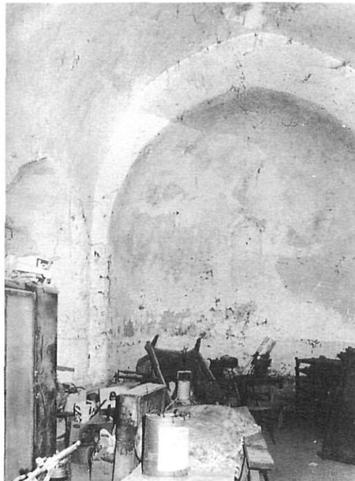
Estat actual de l'interior de Valldemaria.

El dia 20 de novembre de 1456 es produeix un esdeveniment insòlit i insospitat, que es reflecteix en un document, un pergami, de l'Arxiu Diocesà de Girona. És l'acta d'unió del priorat de Valldemaria amb el monestir de Sant Feliu de Cadins, dues comunitats que, tot i pertànyer al mateix orde, havien viscut sempre sense mantenir aquella relació que en teoria han de cultivar les germanes de religió. Entre les raons que se citen per justificar aquesta unió, figuren l'aïllament del priorat i la insuficiència de les rendes, ambdues absolutament certes, a les quals cal afegir, encara que no es digui, el fet que a Valldemaria només hi havia dues monges, la prioressa