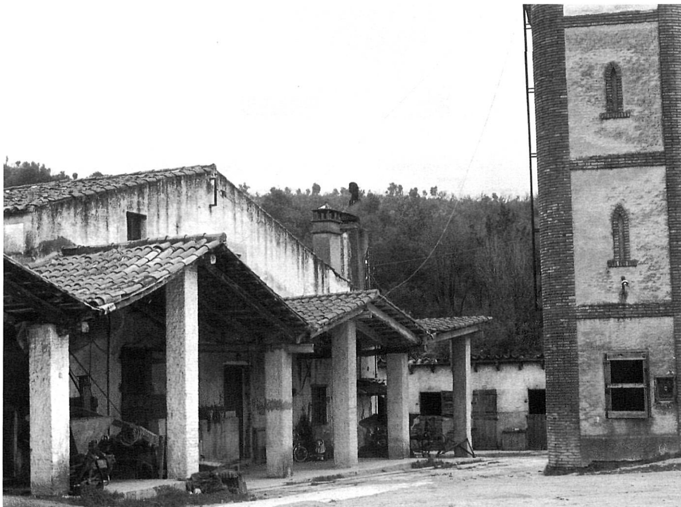
Aspecte exterior de la construcció reformada de l'antic monestir cistercenc.