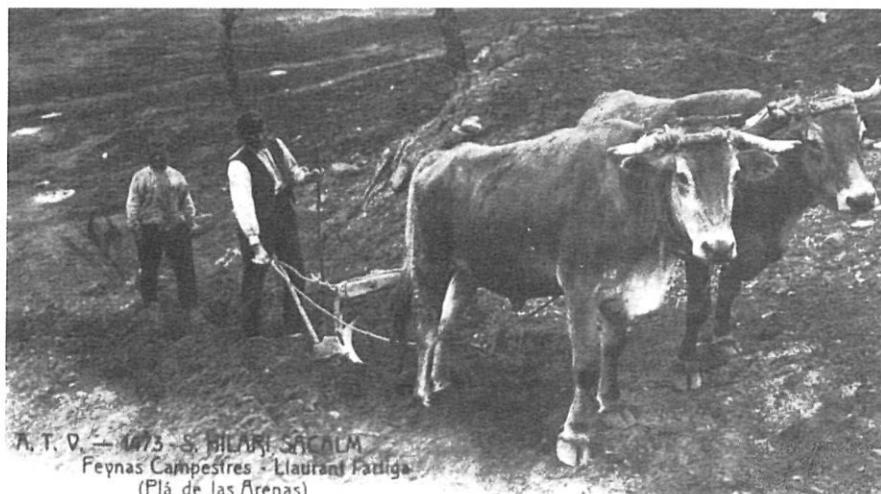
S. HILARI SACALM Feynas Campesines - Llauredí Pausa (Plà de las Arenas)