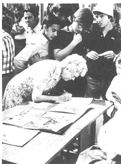
Signatures a l'Escala a favor de l'Alfolí.

L' Alfolí de la Sal, l'edifici més antic de l'Escala, és declarat per la Generalitat de Catalunya monument històrico-artístic de caràcter nacional el 20 de juliol de 1984.