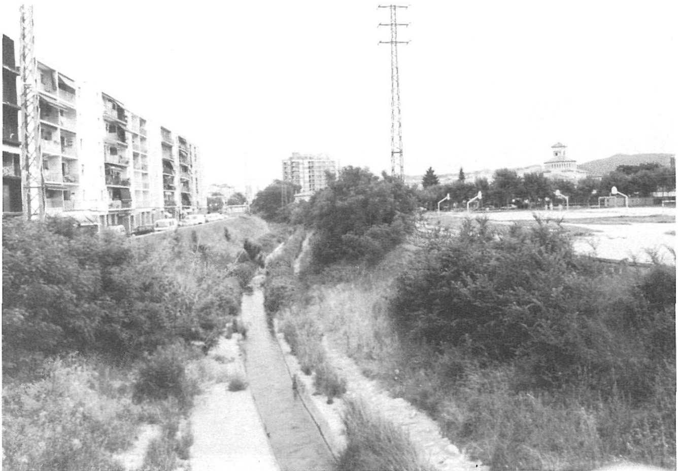
A l'esquerra del Güell, ja canalitzat, Santa Eugènia; a la dreta, Sant Narcís.

de mig centenar d'habitages protegits entre la via fèrria d'Olot i el riu Güell, i la carretera de Girona a Santa Coloma de Farners. Aquest nou grup és el barri de Sant Narcís, que suposa la dispersió del teixit urbà entre Girona i Salt, tot amenaçant continuadament el traçat natural del riu.