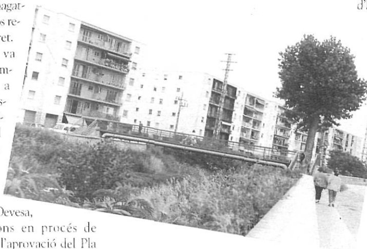
Pont de l'Àngel.

Parcial del Güell l'any 1986. Tot seguint paral·lelament la línia de ferrocarril arribava a desguassar al final del passeig de la Copa, a l'Onyar, quasi davant de la desembocadura del Galligants. Posteriorment, aquest tram ha estat utilitzat per fer mercats a l'aire lliure, dimarts i dissabtes.