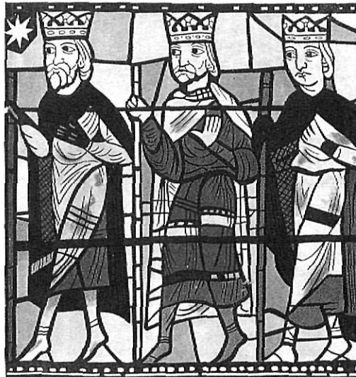
Revista de la Sección Femenina dedicada a las maestras

vuitantena de pobles de les nostres comarques i on les mestres també hi tingueren un paper actiu i també en les Escuelas de Formación que, en pobles petits, fa la mestra voluntàriament; penso en el treball que es fa, ja en la dècada dels seixanta, en el Col·legi Menor que s'estableix a Girona; penso en tot el treball que es fa en els albergs i campaments; penso... En fi, que la història de la Secció Femenina gironina encara està per fer. I seria bo que totes aquelles persones que hi varen treballar tan activament ens expliquessin el seu treball de molts anys.