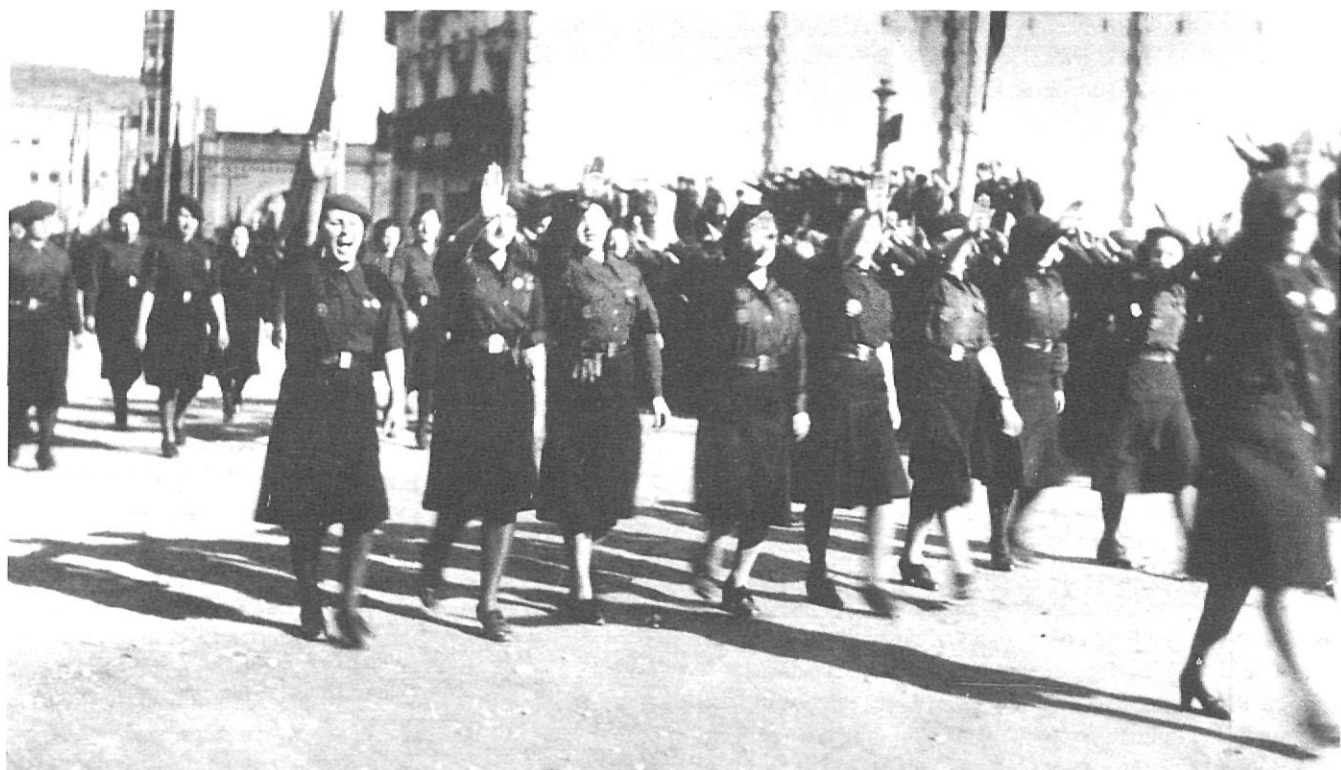
A la immediata postguerra als carrers de Girona es podien contemplar desfilades de les noies de la Secció Femenina, com aquesta que va ser captada a la Gran Via.

resignació segons com sigui l'ambient familiar, la vivència de la guerra i la intensitat de la depuració. Una mestra que va ser delegada local de la SF en una població de la costa reconeix que «m'hi vaig veure obligada a causa de les pressions d'una meua parenta de Girona, però», afegeix, «jo no vaig fer mai política». Aquesta afirmació «Jo no vaig fer mai política» ens la diu més d'una mestra que estava promovent activament la Secció Femenina en la població on exercia.