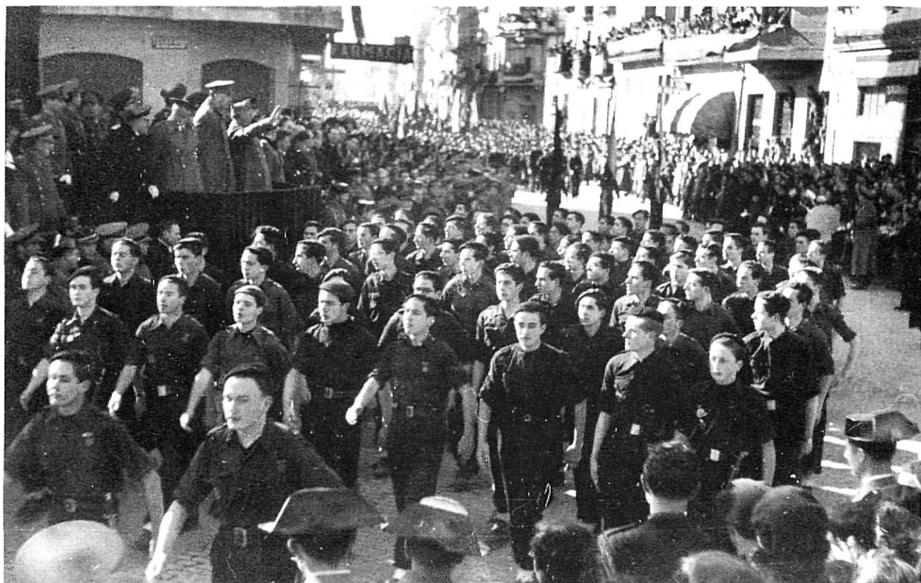
Desfilada de membres del Frente de Juventudes durant la visita que Franco efectuà a Girona l'any 1942.

afiliats confirmessin la pertinença a l'organització és també un símptoma explícit de la davallada dels efectius. Vet ací el text revelador de la crisi: «Según órdenes superiores, todos aquellos afiliados a las Falanges juveniles de Franco que en el transcurso de un mes, a partir de la presente nota, no confirmen su permanencia en la Organización mediante su asistencia a las reuniones de Cennuria semanales, perderán todos sus derechos para la obtención de certificados, bolsas del libro, becas, etcétera» (7).