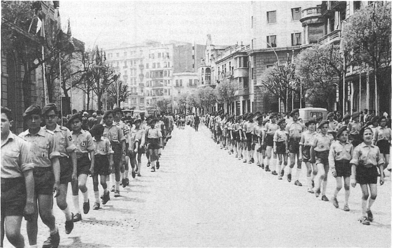
Els components de l'OJE desfilant pels carrers de Girona l'any 1962. L'uniforme havia perdut el color blau.

es qüestiona la llibertat dels acampats a l'hora de plaçar les tendes, la manca d'instal·lacions fixes o la de la bandera espanyola, i es conclou constatant que, «en realidad, creo que no podemos hablar de campamentos, tal y como lo entendemos en nuestra Organización» (10).