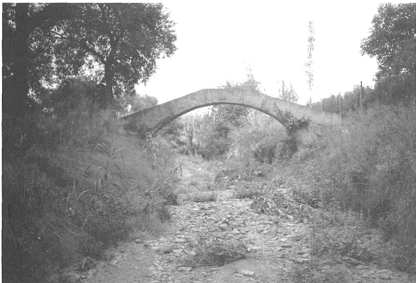
El llit de l'Aubi i un vell pont en el terme de Mont-ras. El segueix paral·lelament el camí ral de Palamós a Palafrugell.

per la gent de Mont-ras. En aquesta àrea trobem també la font de can Jonama prop de la masia que porta aquest nom.