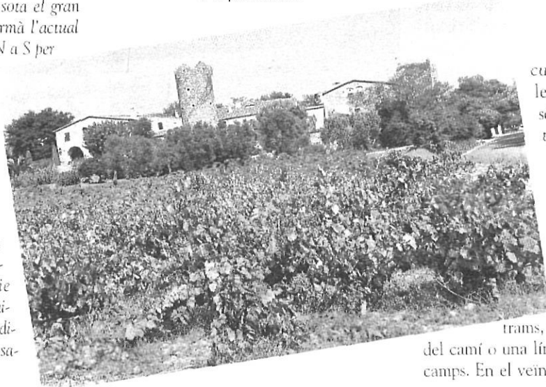
El veïnat medieval de Santa Margarida, el qual dona nom a la petita riera.

En un escrit posterior, publicat a Fruita del Temps , núm. 2, Josep Pla ens proporcionà una precisió important: «a tocar la població, a ponent, hi passava l'Aubi, avui carrer de la Caritat, que seguia inicialment fins a Palamós».