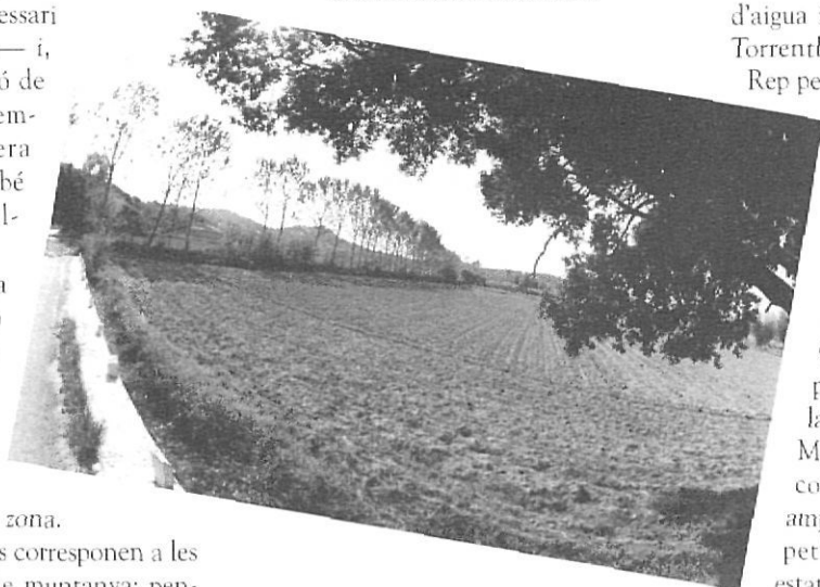
La línia precisa d'arbres de ribera ens mostra el curs decidit de l'Aubi en direcció a les seves desembocadures.

Rep per la dreta també, la riera dels Sois, que baixa del puig Teret, prop de can Borbon. Més avall, li tributa també per la dreta el petit torrent de la Genisa. Entre la riera dels Sois i el torrent de la Genisa, rep per l'esquerra el rec Gran, que baixa des del puig de Cucala. Arribem al veïnat que porta el nom del torrent i travessa la carretera a través del pont d'en Miquies. Des d'allà i fins a la seva confluència amb l'Aubi és un curs ample. Prop d'aquest punt trobem un petit pont sobre l'Aubi, també en estat bastant ruïnós.