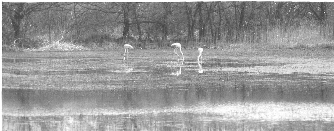
Els Aiguamolls de l'Empordà