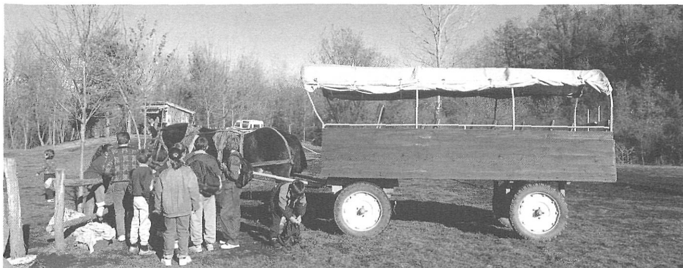
Passeig per la fageda

sa d'aquesta zona, per mitjà de la Llei 21/1983 que declarava els aiguamolls com a Paratge Natural d'Interès, però després de l'aprovació de la Llei catalana 12/1985 d'espais naturals va rebre la denominació de Parc Natural. El tercer parc va ser el del Cadí-Moixeró, creat a partir del Decret 353/1983. Cal assenyalar que aquest parc està a cavall de les comarques de la Cerdanya i del Berguedà, tenint la seva seu a Bagà (Berguedà). I el quart és el del Montseny, que va ser creat a partir d'un Pla Especial del 1977 de la Diputació de Barcelona, encara que el 1987 el Parlament de Catalunya el va reclassificar com a Parc Natural. D'aquest parc, només un sector pertany a la comarca de la Selva.