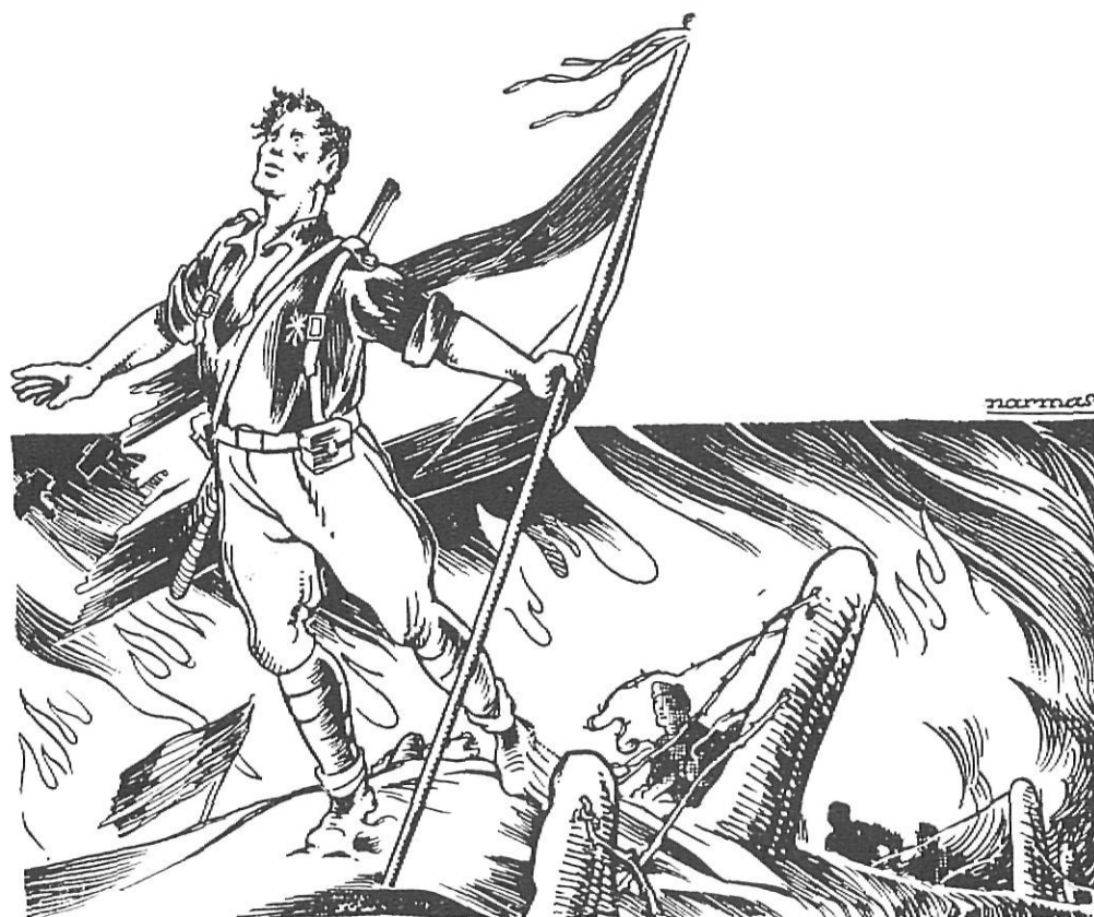
Un dibuix gironí característic de la primera època franquista.