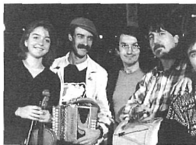
La Clau de Lluna