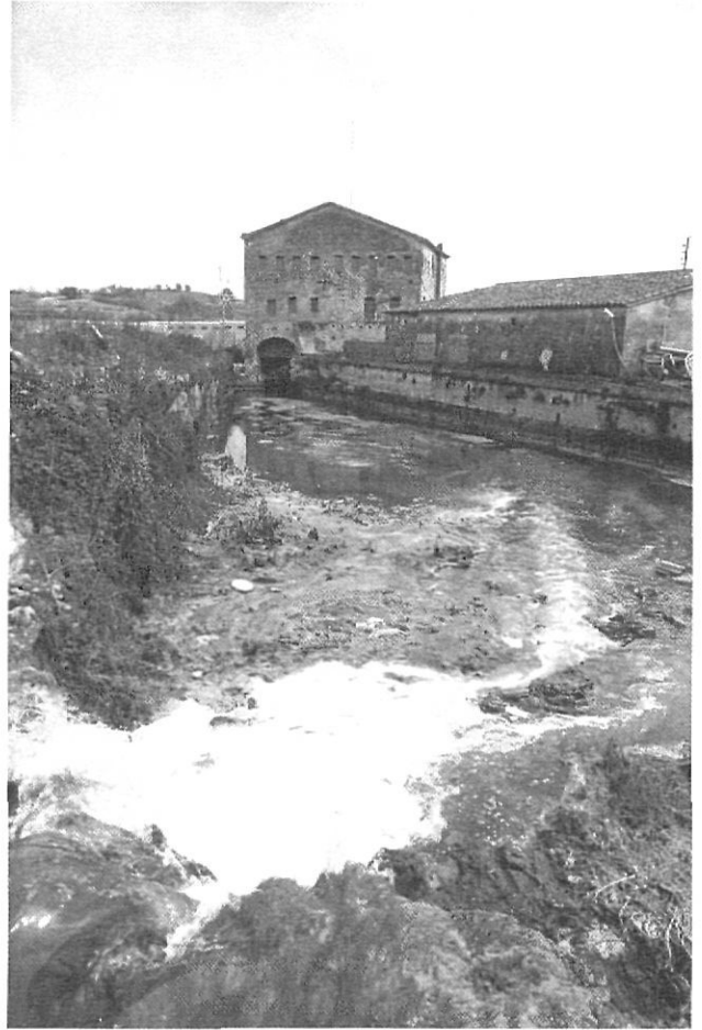
Vista de la Farga de Banyoles, el projecte de restauració de la qual forma part del pla d'infraestructures culturals que la ciutat ha endegat els darrers mesos

També cal constatar que, a diferència d'altres municipis, la delegació del liderat en la vida cultural de Banyoles a les administracions democràtiques no ha donat