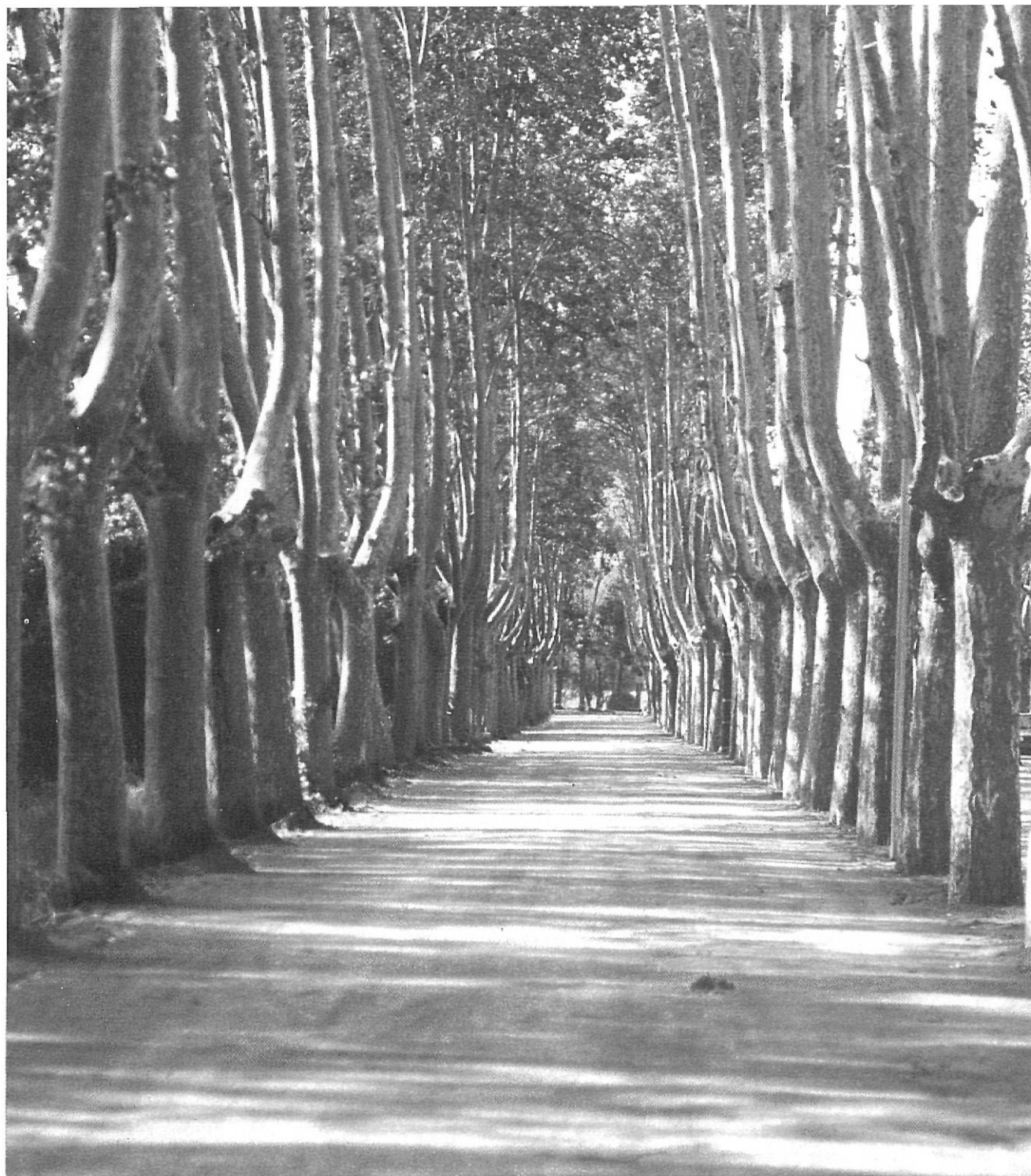
Perspectiva del passeig Dalmau