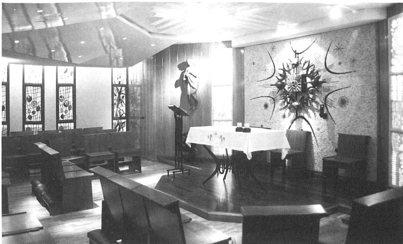
La capella del convent actual.

Després d'una pila d'anys d'intensa activitat en totes les dedicacions que són peculiars de la institució, a la comunitat d'adoratrius de Girona se li planteja una nova problemàtica: l'emplaçament del convent es veu afectat per un nou pla urbanístic. En realitat la presència d'aquell gran edifi-