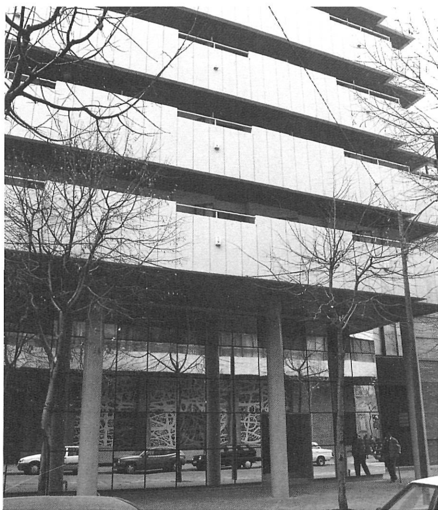
La nova casa de les adoratrius, en el mateix solar del convent enderrocat.

l'alcaldia comunica a la superiora que hauran d'allotjar 400 soldats que estan a punt d'arribar a la ciutat. Les monges protesten vivament i quan arriben els oficials per fer-se càrrec dels locals, es deixen convèncer sense massa dificultat que aquell no és el lloc adequat per allotjar els seus soldats. Per solucionar-ho, i d'acord amb el prelat, la tropa s'instal·la al temple de Sant Lluc, que encara no havia estat reconciliat per retornar-lo al culte.