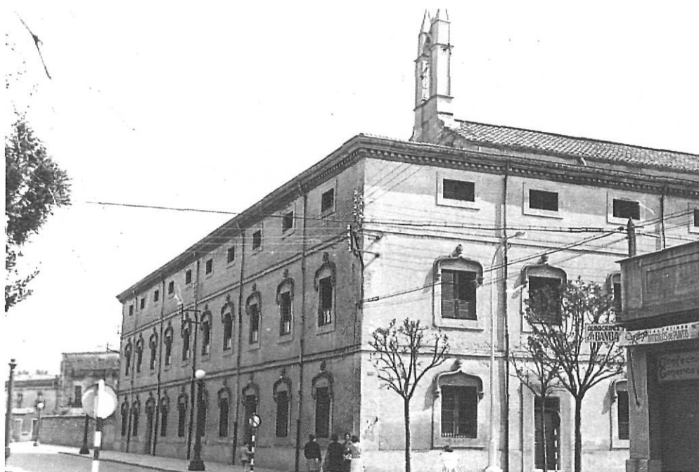
L'edifici de les adoratrius a la cruïlla Joan Maragall-Sant Antoni M. Claret (abans Dr. Robert).