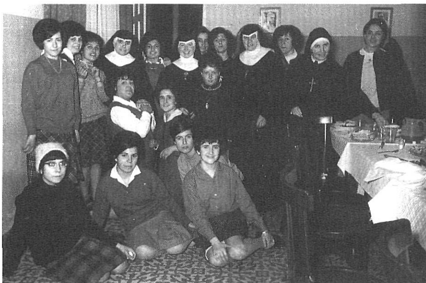
"Al servei de la joventut femenina de la ciutat i de les seves comarques."

Paula. L'accés des del centre de la ciutat resultava difícil pel fet que no s'havia obert encara el carrer de Joan Maragall. Per tant, desplaçar-s'hi des d'una zona tan propera com era el barri de l'Hospital requeria donar la volta o bé per la carretera de Barcelona, per trobar la ronda davant la plaça del Carril; o bé pel carrer d'Ultònia per accedir-hi per l'extrem oposat. En la Girona de reduïdes dimensions i d'exigües distàncies aquests itineraris es consideraven llarguíssims.