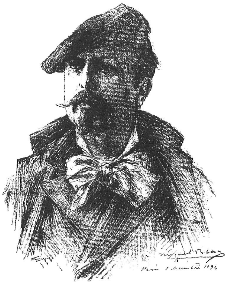
Joaquim Vayreda i Vila. (Dibuix de Miquel Blay)

contat a tres generacions de la família Vayreda durant les vetllades d'hivern a la vora del foc, i que li serveix per extreure algunes lliçons de conducta (6). Ja ací queda reflectida una de les idees que trobarem repetida en el seu pensament polític, afí al catalanisme conservador de la Unió Catalanista i que desenvoluparà al llarg de les Tres Generacions : que el món modern pugui oblidar i menysprear els consells i ensenyaments hereus de la tradició. Vayreda escriu: «quan un personatge es llança pel camins desconeguts sense tenir en compte els consells dels avantpassats gairebé segur que fracassarà». Aquesta màxima també la dirigeix als catalanistes, «aquells que treballen amb santa fe per nostra verdadera reconstitució, los quals logran son fi si no se separen de lo bon camí emprè» (7). En les Tres Generacions aquesta idea esdevé materialitzada en un llibre ja present en el primer capítol i personalitzada en la figura del fill de Clara, el nét de Jaume Andreu, que no apareix fins al darrer capítol. El llibre és el manual de conducta d'aquest. En ell hi apunta totes aquelles màximes i sentències, «filles de sa pròpia experiència» que li seran d'utilitat i ensenyament. El seu avi el va començar i el seu pare el continuà. Gràcies als consells i ensenyaments allí escrits, la seva filla Clara podrà reeixir d'unes desagradables si-