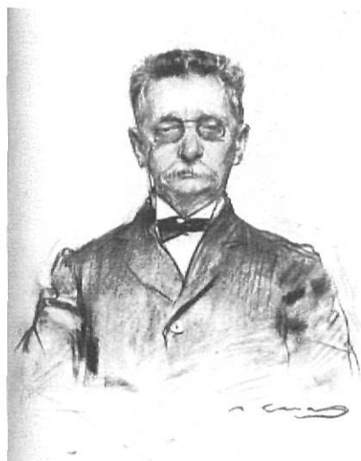
Lluís Domènech i Muntaner.