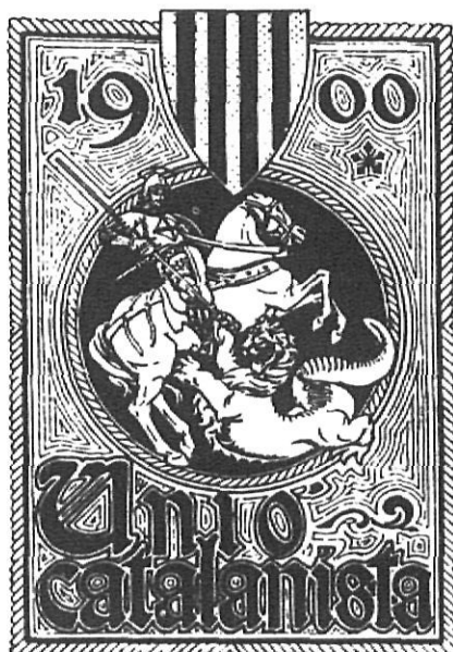
L'emblema de la Unió.

En conjunt, no pot pas dir-se que en el seu moment la creació de la Unió Catalanista i l'aprovació de les Bases de Manresa significuessin un capgirament del marc polític català. De fet, la premsa contemporània en féu un ressò molt apagat. El catalanisme era, encara, una qüestió amb poc escalf popular i amb una incidència pràctica molt poc concreta. No deixa de ser contradictori que els mateixos que aprovaven que «la llengua catalana serà l'única que amb caràcter oficial podrà usar-se a Catalunya i en les relacions d'aquesta regió amb lo poder central», aquests mateixos delegats continuessin escrivint normalment en castellà; O que la confusió sobre la divisió comarcal fos total, tot i ser considerada per les Bases com a «fonament» de la divisió territorial dels poders governatius. La mateixa composició dels delegats, amb una aclaparadora majoria dels professionals liberals i dels intel·lectuals, seguida d'una important presència de propietaris, sobretot rurals, ens revela nítidament el caràcter conservador i minoritari de l'Assemblea. No faltaren les manifestacions subratllant que les Bases no eren cap projecte separatista, ni tan sols un programa polític, sinó l'aprovació d'uns principis generals que havien d'encarrilar el regionalisme. En general, els debats foren grisos,