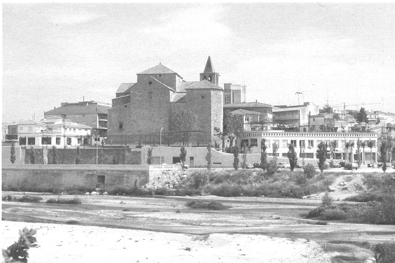
«La població de Tordera, centre firal agrícola i ramader es troba situada a mà dreta, aigua avall d'un illot del riu».

d'escuma blanca, d'on es creu que prové el nom de Gualba o Aigua Blanca.