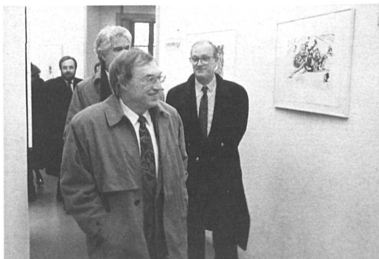
El ministre de Cultura del Govern central, Jordi Solé Tura, durant la seva estada al Teatre-Museu Dalí.