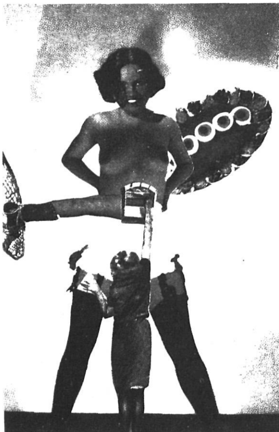
«Le Message», 1935. A la dreta, la casa natal de Remedios Varo, a Anglès.