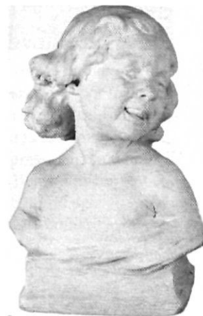
El mosaic de Bell-lloc i un bust de Ricard Guinó.