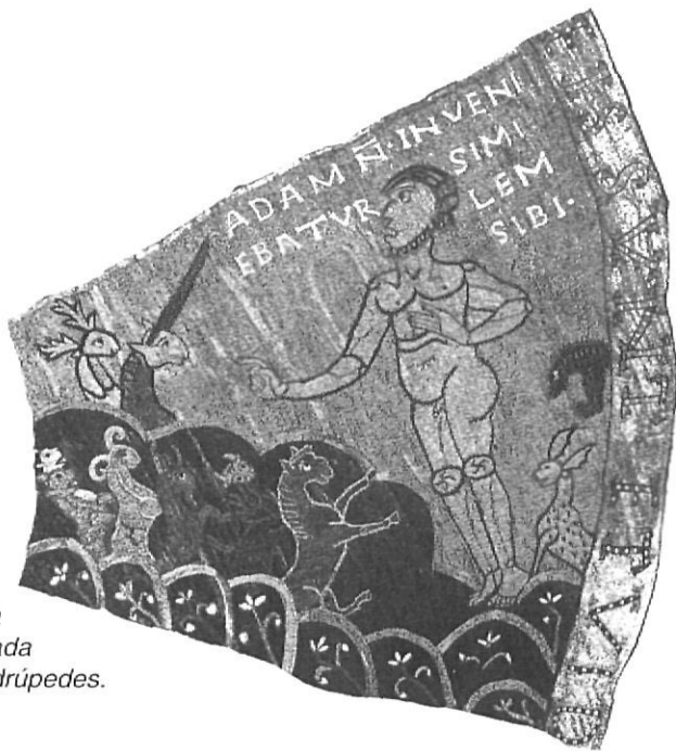
Fig. 1a. Figura gegantina d'Adam comparada amb la dels quadrúpedes.

tava l'emperador Constantí. Encara avui anomenem de Carlemany els elements que resten del temple romànic.