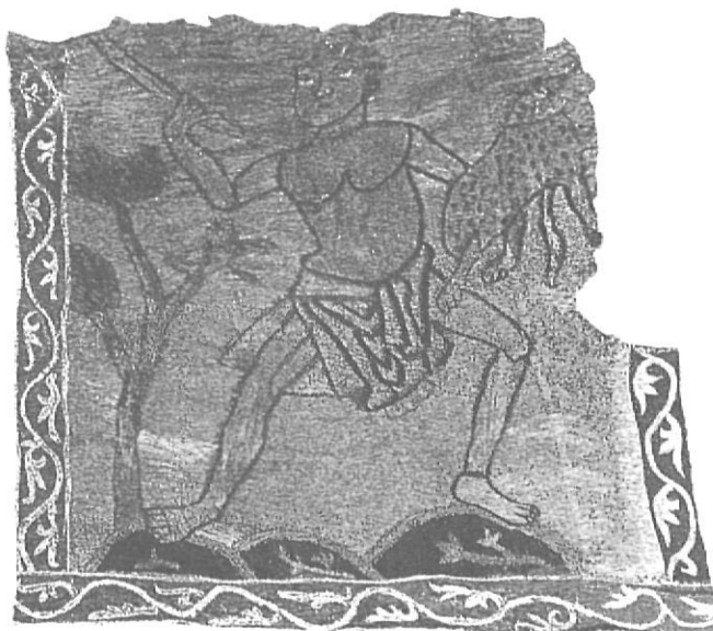
Fig. 3a. David brandant un garrot per matar una fera.

Però aquesta llegenda no fou una creació de Voràgine; «Aquest,