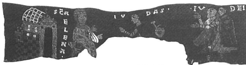
Fig. 4a. Santa Elena preguntant els savis jueus i els jueus assenyalant Judes.

Era ensems un profund coneixedor de Litúrgia, de la qual va expressar plàsticament el contingut