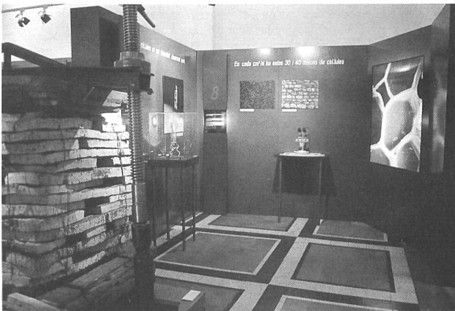
Una sala del Museu del Suro de Palafrugell.

Els estudis fets fins ara en el món surer s'han centrat en temes més directament relacionats amb la productivitat i que afecten la matèria primera i la seva qualitat i possibilitats. No és així, en canvi, en els aspectes d'història social i econòmica, aspectes en els quals el museu pot ser de màxima utilitat.