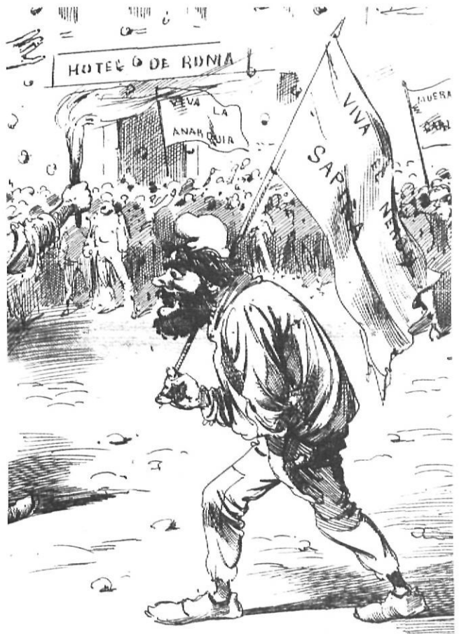
Tot i algunes excepcions, carlins i republicans mantingueren posicions de rebuig frontal uns pels altres. La imatge que presenten a la premsa dels seus contraris n'és una mostra ben evident. A l'esquerra, portada del número extraordinari de «L'Esquilla de la Torratxa», el setembre de 1934, dedicat als «Cent anys de carlinada». A la dreta, fragment d'un dibuix publicat a la premsa carlina l'any 1890, amb motiu dels aldarulls que es van produir a València a conseqüència de la visita del marquès de Cerralbo, que s'havia d'allotjar a l'Hotel de Roma.