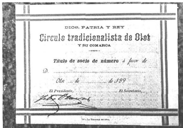
Els cercles tradicionalistes eren la base principal de l'estructura que adopt3 el partit carlista entre els anys 1888 i 1900. El 1896 n'existien, arreu d'Espanya, un total de 307. El Cercle tradicionalista d'Olot (1889-1900) va ser el primer dels creats a la província de Girona, seguit pel de Palafrugell. A l'esquerra, dibuix de la façana i interior del cercle olotí, publicat al setmanari «Lo Crit d'Espanya» el 1890. A la dreta, carnet de soci d'aquest mateix cercle.