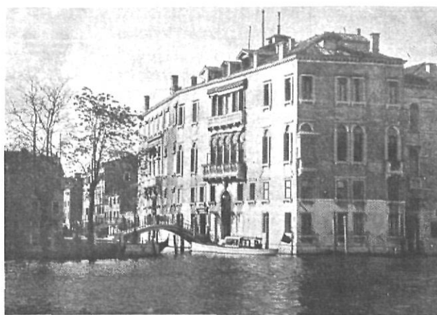
El Marquès de Cerralbo va exercir entre els anys 1890 i 1899, i entre 1912 i 1918, la màxima representació del pretendent Carles VII a l'Estat espanyol, tot dirigint, així doncs, el partit carlí. A dalt, un dels salons —l'anomenat Saló del Chaflán— del palau del Marquès de Cerralbo a Madrid. A baix, el palau Loredan, a Venècia, on va viure durant la major part del seu exili Don Carlos.