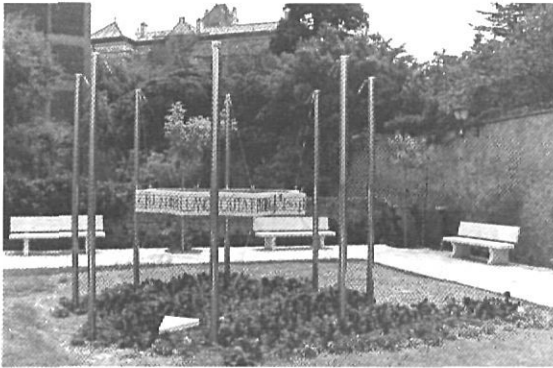
Monument a la sardana. Llançà. (Autor: Bonaventura Ansón)