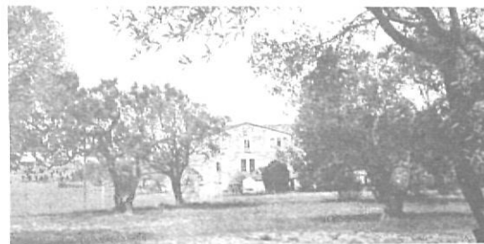
A dalt, l'expedient acadèmic de la Facultat de Dret de Barcelona. Al costat i a baix, exterior i interior del mas Pla de Llofrin.