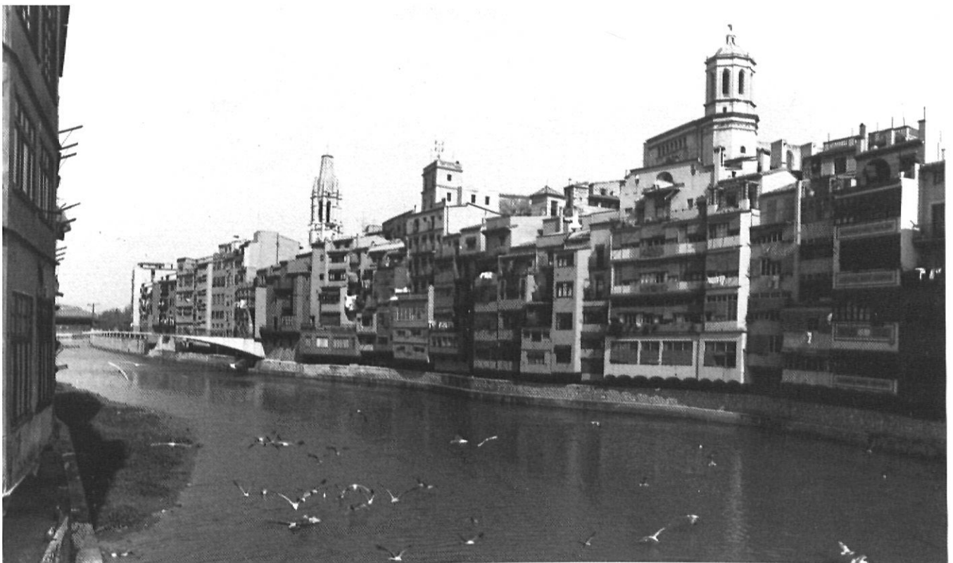
«Parlaríem de les cases pintades, dels gavians i de la dotzena de ponts»

Si esbrinem els records més antics que té del riu la gent de Girona de més