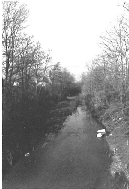
«De la Creueta a Vilobí, el riu passa, no gaire net, mandrejant entre les arbredes»

I, deixant Girona, ja, el record de l'Onyar dels pobles utilitzat per banyar-s'hi, beure-hi o pescar és molt més recent encara. De la Creueta a Fornells, de Fornells a Riudellots, de Riudellots a Vilobí, el riu passava, no fa gaire, net, mandrejant entre les arbredes de ribera, aprofitat. I és potser per un d'aquests aprofitaments, l'agrícola, que els municipis afectats per un projecte de construcció de preses de fora de Girona s'hi varen oposar fortament. Era pels volts de l'any 70 i es plantejà la necessitat de regular el riu amb preses de laminació. Aquests tipus de presa no són embassaments permanents sinó que només s'om-