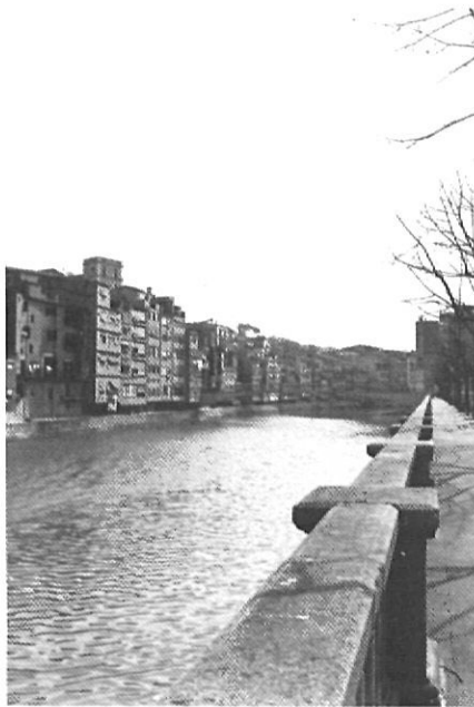
«Llevat del dia que plou una mica més del compte, a Girona l'Onyar és tranquil»

vessa, i ens passem més estones destriant els colors de les façanes que s'hi emmirallen i apartant-nos dels objectius fotogràfics dels turistes que l'empresonen des dels ponts que no pas tenint-li por. Llevat del dia que plou una mica més del compte i del vespre que clou les Fires, quan tot Girona és a la plaça Catalunya mirant el cel encès, l'Onyar és tranquil. I si parlo del dia dels focs és perquè m'impresiona aquella mica d'esquerda que es va obrint de tant en tant a l'asfalt del cobrellit del riu, com una punta de rebel·lió. I el dia dels focs m'hi fixo més i hi penso més, també. Però, després, ja no tant. I, normalment, m'agrada travessar la plaça Catalunya per la part de les baranes i, amb les claus, fer teclejar el ferro. Pel pont de Pedra hi passo poc perquè és massa alt i no veig bé l'aigua de sota. Del de les Peixateries