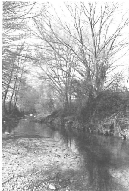
«El record de l'Onyar utilitzat per banyar-s'hi, beure-hi o pescar és molt recent encara»

Si l'Onyar tingués una llegenda d'aquestes de llibre, amb dones d'aigua o bruixes dels gorgs, ben segur que s'hagués originat pels voltants de la resclosa de can Borra o més amunt i tot, prop del seu naixement. Però ni les persones més grans i arrelades a la contrada ni els llibres d'històries i llegendes no saben res del tema, com si tot l'anecdotari del riu es reduís a les seves