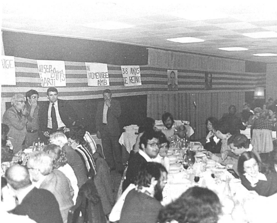
Any 1976 Desè concurs literari. Panoràmica de la festa. Al fons els organitzadors.

— El premi serà de 3.000.- pessetes i com a símbol del Concurs la «Rosa d'Or». El resultat es donarà a conèixer per mitjà del Secretari del Jurat durant el sopar que tindrà lloc el dia 22 d'abril