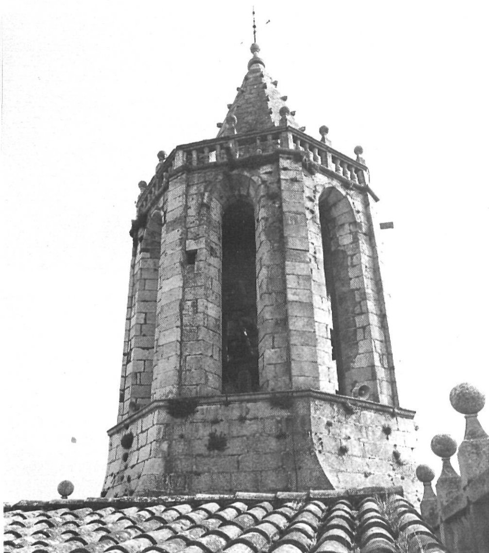
El campanar de Cassà, talaia emblemàtica de la vila.