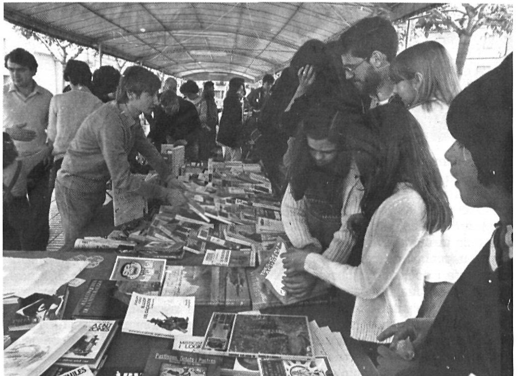
Any 1985 Activitats paral·leles a la Festa Literària. Dia del llibre i de la rosa

El fet és que la iniciativa va continuar endavant, i això va crear tensions al si de l'entitat. Companys de junta, o simples col·laboradors de «la Colla» des dels seus inicis a mitjan anys cinquanta, van presentar la seva dimissió, i fins i tot presentant la baixa com a socis de l'entitat. El motiu de la dimissió queda clarificat amb aquestes paraules que resten escrites a l'arxiu de «la Colla»: «... la Colla se está poniendo en asuntos que no nos gustan» «Feu política!!», ens deien. I aquí es va encetar un debat intern per entendre si era veritat que en fèiem. És clar que en el sentit estricte del mot no. Però quan vam deci-