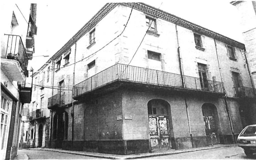
El Centre Agrícola i Social de Castelló d'Empúries

a recursos extremos y violentos» [NEGRE, 1921: 200].