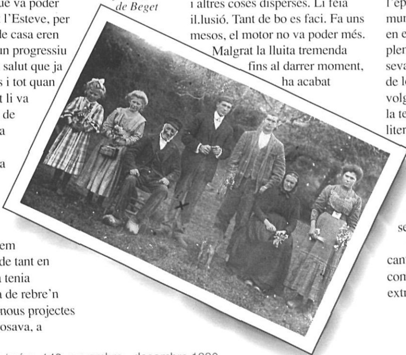
Els Puigmal, una vella família de Beget