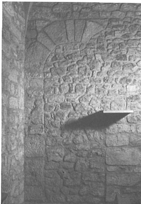
L'arc interior de la porta romànica de tramuntana en el seu estat actual.

Era realment una església, des de bon principi, l'edifici romànic de Cornellà? La diferència de nivells entre les dues finestres de la façana del nord és un altre detall que acaba de plante-