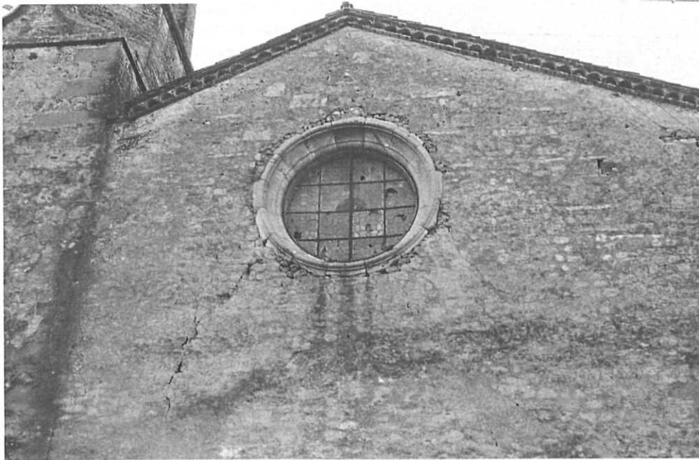
A l'actual façana de l'església, a llevant, sota el remolinat, s'hi observen, també, fragments d'aparell romànic