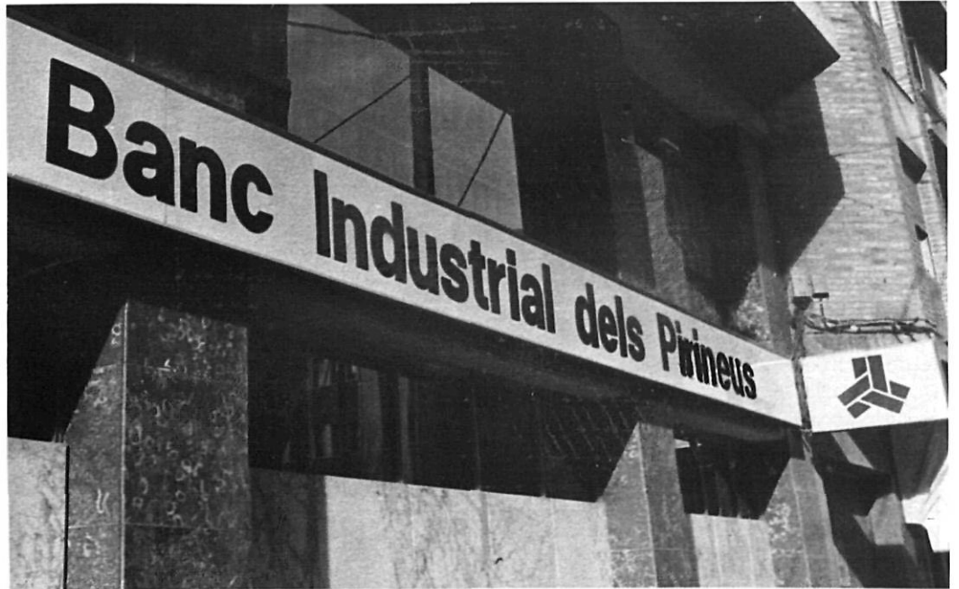
El Banc Industrial dels Pirineus.