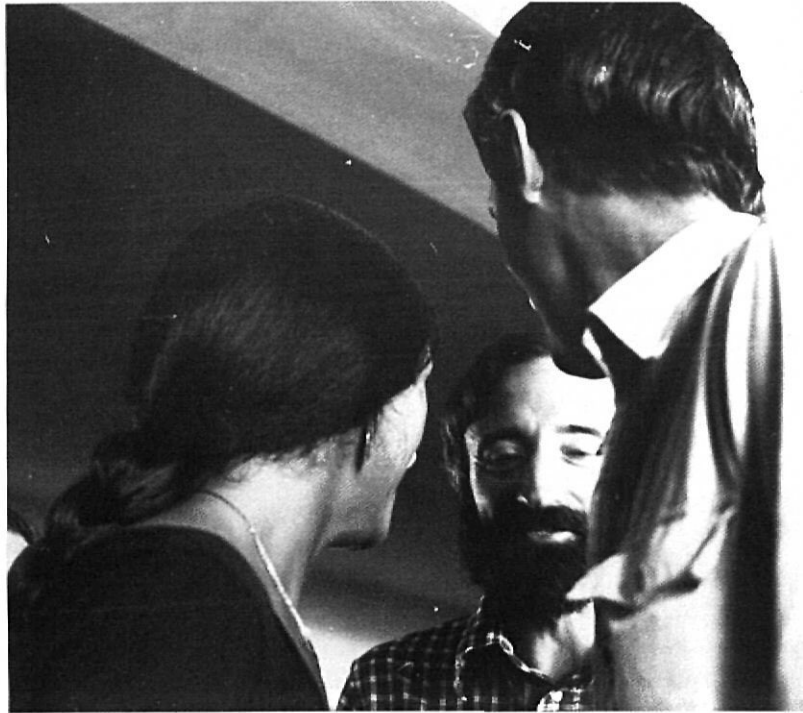
L'autor d'aquest article, en plena Escola d'Estiu.