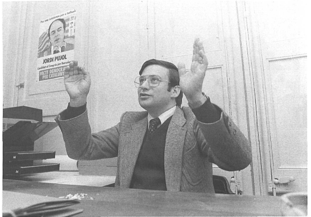
L'autor d'aquest article, sota un cartell del Pacte Democràtic.