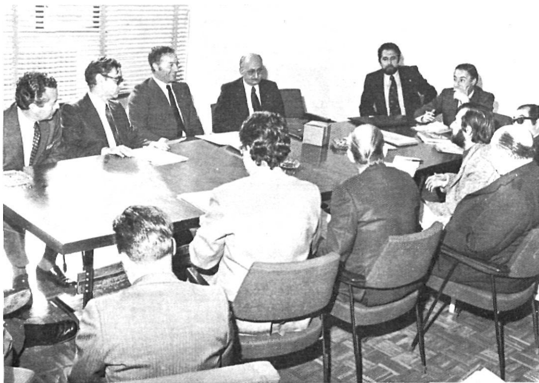
Roda de premsa del governador Anguera, abans de la transició.