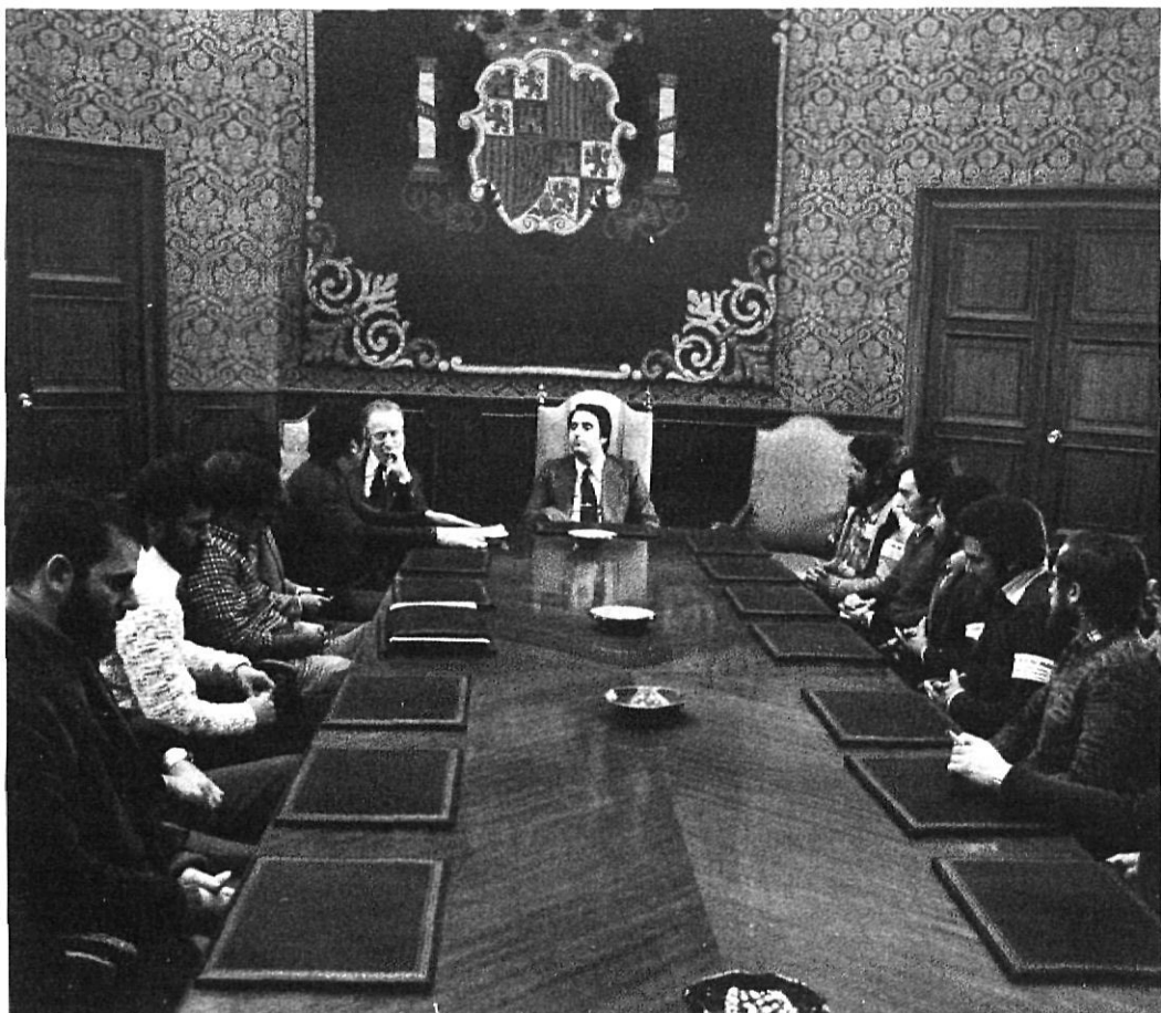
Roda de premsa del governador Mesa, en plena transició.