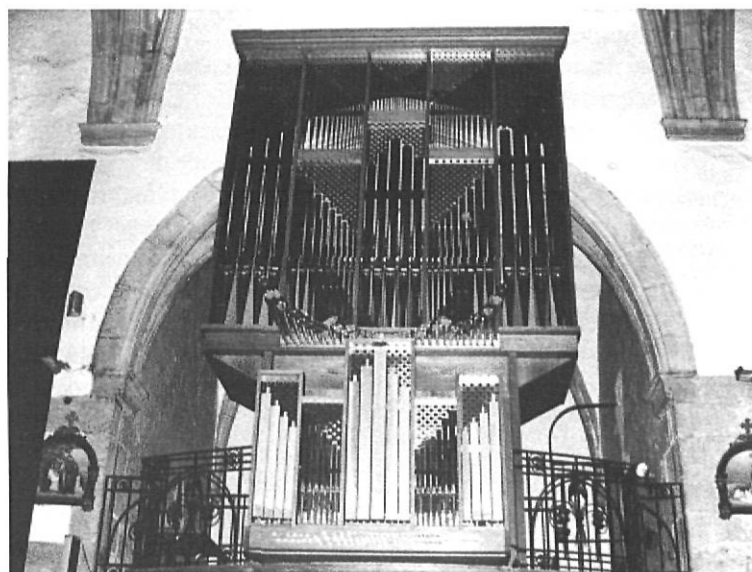
El nou orgue de Llívia, un dels millors de Catalunya.

tes les que afavoreixen un mal concepte de l'orgue i el ridiculitzen. Sovint són persones que amb una formació pianística confonen el tractament del teclat, no s'adonen que l'orgue és un instrument de vent i que res té a veure amb l'acció percudida de l'instrument de corda que és el piano -en aquest cas- i que l'orgue, cada orgue, ha de respirar, ni que sigui per acompanyar la litúrgia. Aquesta és una qüestió que els organistes formats profes-