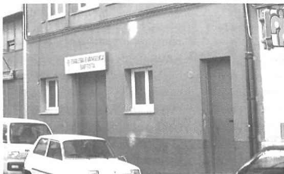
Un rètol senzill indica l'existència d'una església evangèlica

la Llei 7/1980, que garanteixen el dret fonamental a la llibertat religiosa i de culte i la no discriminació per motius religiosos, i declaren que cap confessió religiosa no té caràcter estatal.