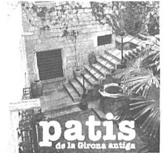
Patis de la Girona Antiga . Girona, Diputació de Girona, 1990, 50 pp.

La publicació té per objecte homenatjar uns personatges que s'han convertit en símbols de molts olotins.