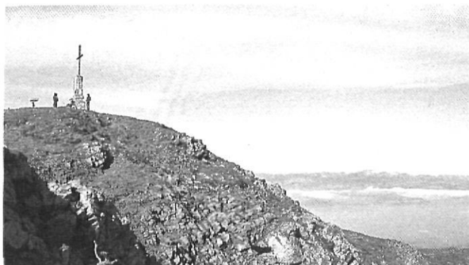
El cim de Matagals (1699). Riera de Viladrau.

El territori, en canvi, és una entitat viva i, per tant, dinàmica i canviant. Si, a més, és un territori habitat per l'home,