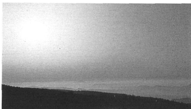
El Pla de la Calma, amb Montserrat al fons, Sant Marçal i les Agudes

L'experiència acumulada durant els anys de vigència del Pla Especial del Montseny permet afirmar que aquest és un instrument que s'ha mostrat útil per acomplir les finalitats preteses. Amb tot, han existit i existeixen dificultats importants que només poden ser superades si les diferents administracions i estaments socials assumeixen la seva quota de responsabilitat en donar acompliment al planejament vigent.