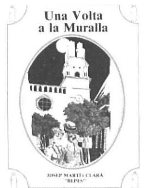
Els llibres d'en "Bepes"