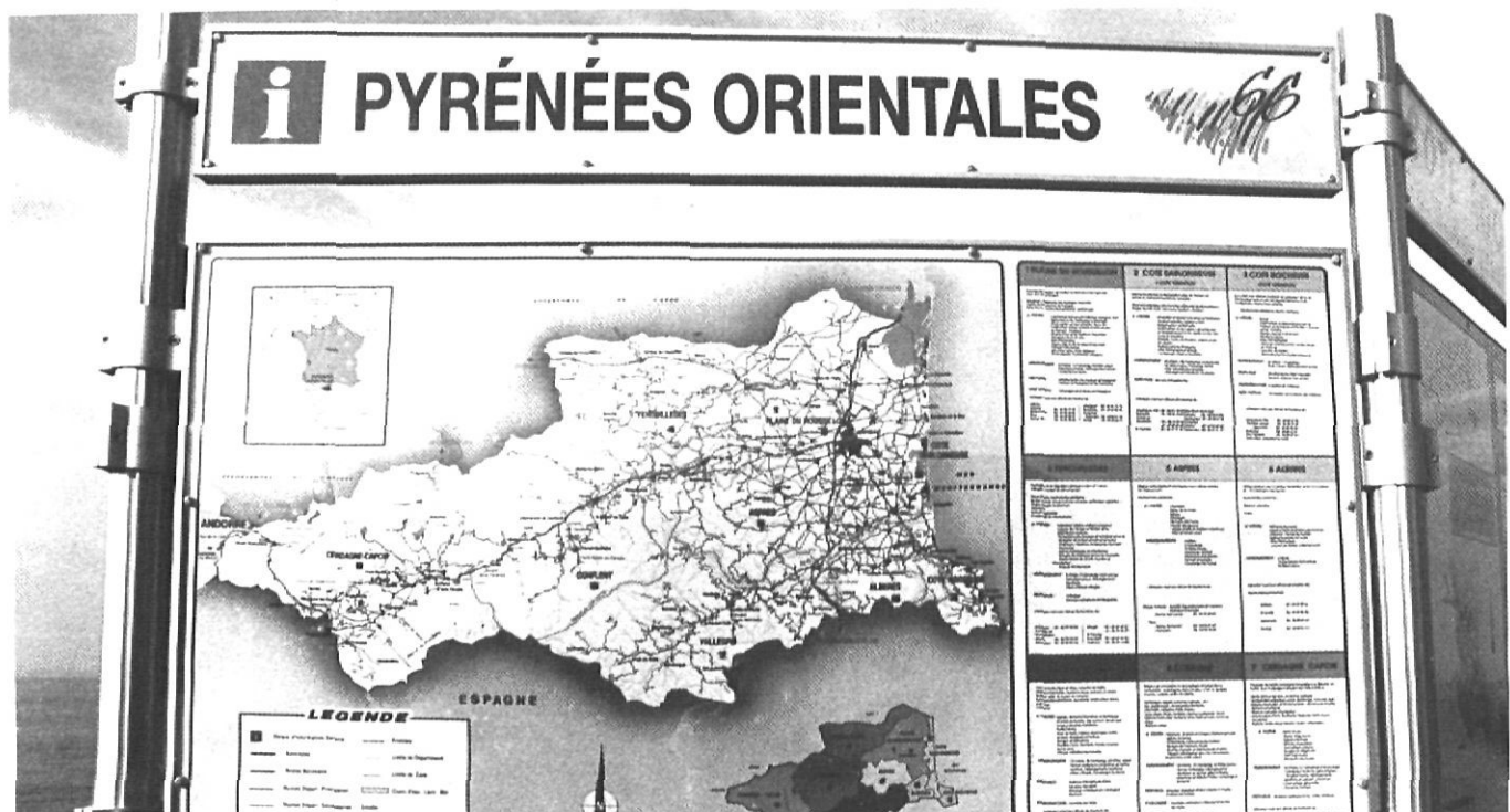
L'oferta turística d'una regió transfronterera

Hem de saber que ens esperen moltes traves si volem crear una euroregió catalana. No són insuperables, però sovint haurem d'imaginar aquí mateix les solucions, car els models de les altres regions són específics o ells mateixos incomplets. Ara bé, la situació nova, d'aquí uns anys, obligarà als estats, a les regions i a la Comunitat europea d'enfrontar-s'hi i trobar solucions. Aquestes seran probablement inspirades per iniciatives concretes transfrontereres, i generalitzades. Tenim, doncs, grans oportunitats i camp per córrer. Les iniciatives novadores -i a hores d'ara mai proposades a Europa- de Cervera i Portbou van per aquest camí.