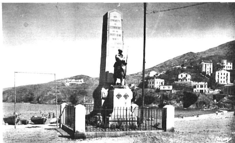
Monument als morts de Cervera i Portbou durant la primera guerra mundial, que existí a Cervera

El segon bloc concerneix el salt endavant de la producció industrial, tant per l'impuls de les economies d'escala ja esmentades com per l'obertura real dels mercats, amb les creacions correlatives de llocs de treball dins la indústria i dins el terciari. Es clar que les creacions de nous llocs de treball no es farà automàticament a les zones afectades pels traumes laborals deguts a les supressions de les fronteres. Això dependrà de la salut econòmica de les regions, de llur capacitat de reacció -tant de les empreses com de les autoritats econòmiques i polítiques-, i de llur afany per aprofitar-se dels nous mercats transfronterers que s'aniran obrint. Tant Girona com Perpinyà seran dins l'ull del cicló, i ara per ara no es pot dir que els responsables nordcatalans es preocupin massa pel tema. Fins i tot, molta gent es pregunta si en tenen una clara consciència.