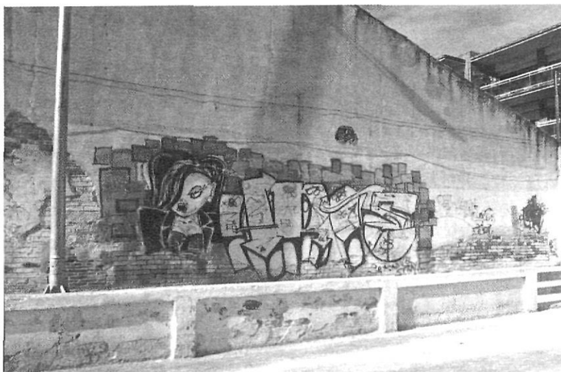
«Arte», graffiti dels OH-40 (Sam, Seen i Taka) al camp de futbol vell.