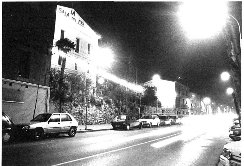
El barri de Pedret és una zona de gran vida nocturna: bars, restaurants, pubs i discoteques.

La Girona moderna i postmoderna comença a la plaça de la Independència i s'estén cap a La Salle: l'esquerra de l'Onyar. El públic és molt més heterogeni, més inclassificable. Hi trobem bars conquistats per una penya específica, però en el bar del costat o de la cantonada hi contemplem un grup que no té res a veure amb l'anterior, fet que no succeeix en el carrer Nou del Teatre. És un personal de sortides intermitents. Parlen entre ells: es nota que tots es coneixen. La gran majoria de clients són nadius de Girona o porten tants anys residint-hi que ja s'han mimetitzat. Els grups són tancats, impenetrables. I encara que sigui de nit en què la gent se sent alliberada per l'alcohol o pel fet que «pecat amagat, mig perdonat», no perden, malauradament, la seva compostura. Fills pretenciosos, fatxendes, de botiguers superbs, la cara més antipàtica de la Girona grisa i levítica, mostren el seu posat tibet i indiferent a la presència del foraster. Per a ell els cognoms, els orígens familiars, representen un factor definidor de la persona. Sovint els no nascuts i/o no integrats a la capital de la província es lamenten que la Girona nocturna no sigui més acollidora, més oberta, i que els circuits siguin tan hermètics i endogàmics.