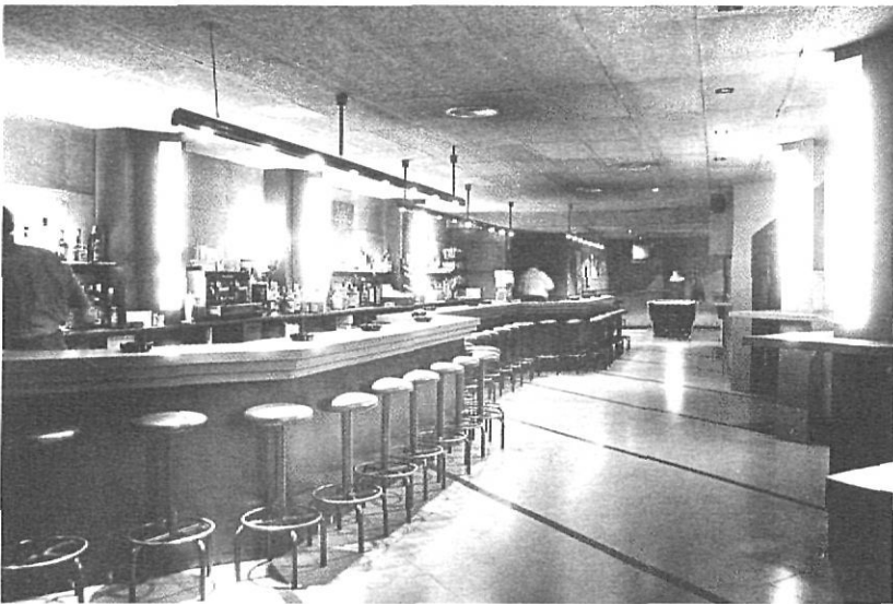
De dalt a baix: aspecte del Cau del Llop: parets de pedra, bigues de fusta, llar de foc... Nummulit, pub en el cor de la ciutat: clients solitaris en un dia flux, i Fractal, el pub més de moda entre els «bollycaos».

per sortir a ballar. En la Sala de Ball de Girona, entre el públic adult hi ha matrimonis, penyes de dones, solterots empedreïts, vidus, separats i homes mal casats. La nit del dissabte és una nit divertida, trepidant, i els cotxes van bojós per Pedret, i tant cotxes com motos zigzaguegen pels traïdors revolts de Montjuïc. És, igualment, una nit de borratxeres (amb l'excusa que el diumenge clapan la mona). L'alcohol consumit en birres i cobates afecta els joves d'ambdós sexes.