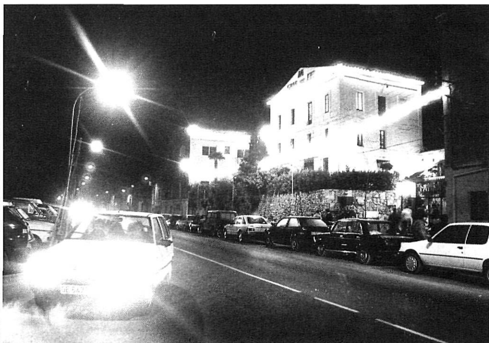
El carrer de Pedret, el gran escenari de la nit gironina.