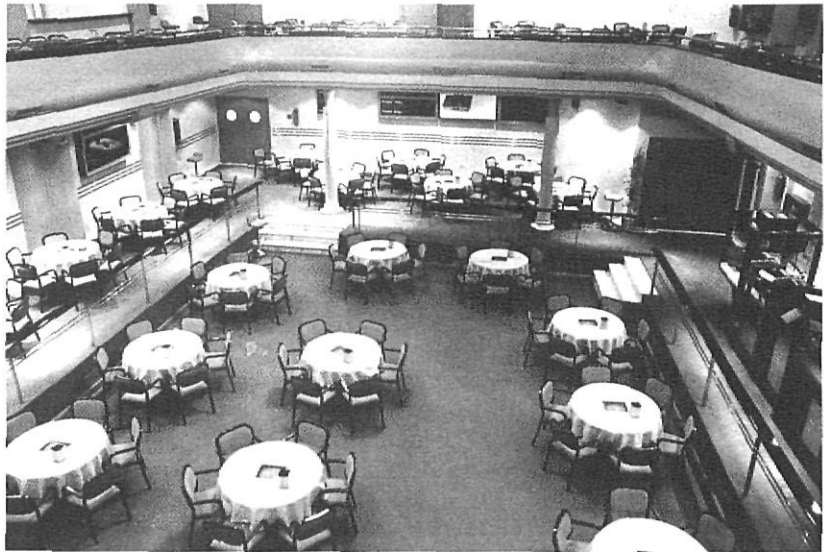
Aspecte del bingo de l'Avinguda Jaume I, al costat de la plaça de la Independència i, a la foto superior, la nit es viu en els locals i no es fa vida al carrer.