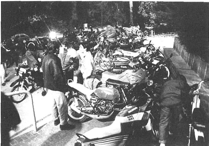
Els «bollycaos», amb les motos a l'entrada d'una discoteca, un diumenge a la tarda.

L'única discoteca oberta és Fashion's, el cèlebre Don Carlo, i després Brisa de nom. He escoltat d'uns quants treballadors de la nit la queixa que Girona no té cap vida nocturna. Irònicament m'han dit: «Vida nocturna a Girona? Tu vols fer un article sobre la vida nocturna? Doncs, en faràs via d'escriure'l, perquè no n'hi ha. Més aviat es podria fer un article titulat: «La falta de vida nocturna a Girona». Ja em diràs