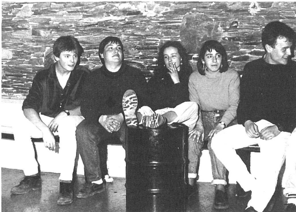
A les «discos» no existeix la comunicació verbal.