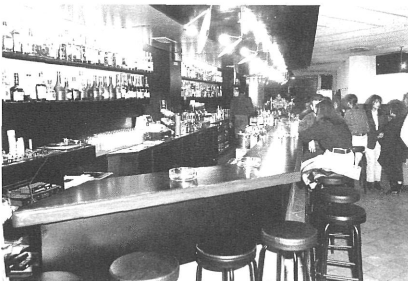
Gass fou el primer pub de disseny a Girona.

El públic del dilluns sol ser d'universitaris residents a Girona (els quals cada divendres es desplacen als seus domicilis familiars), gent que durant la setmana treballa a Girona, especialment funcionaris (per a molts empresaris, els funcionaris signifiquen una clientela cobdiciada a causa del seu poder adquisitiu i pel seu gust per les begudes cares), em refereixo a funcionaris no nascuts a Girona, empleats de correus, a la duana, etcètera.