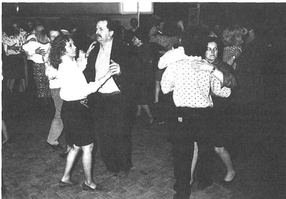
Balls de saló, el dissabte a la nit, dins la Sala de Ball de Girona, amb accents decadentistes.

surten; després de sopar en un restaurant, aniran tots plegats a un pub. El que més convingui. La música dels pubs determina una clientela concreta. I la gent ja sap a què s'exposa. Si són marxosos optaran per pubs de música estrident, a tot volum, i els més carrosses preferiran un espai més suau, més tranquil. De totes maneres cada local té una clientela molt específica, i en certa manera intransferible. Posem per cas: algun habitual de Nummulit per res del món entraria al Freaks (una còpia de l'Enagua de Barcelona) o el Pot-ser del carrer Nou del Teatre, ja que perillaria la seva reputació , i, igualment, succeiria a la inversa.