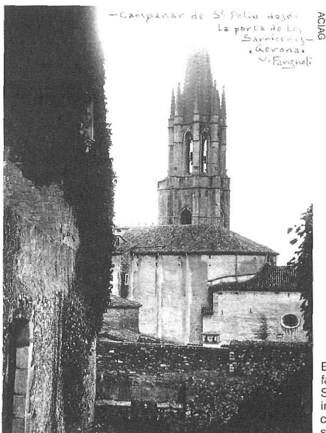
El campanar i la façana lateral de Sant Feliu, en unes imatges de començament de segle.

Quan s'hagi d'actuar en altres punts de l'edifici caldrà fer aquesta lectura arqueològica. Pensem només en la complexitat de la construcció i podem