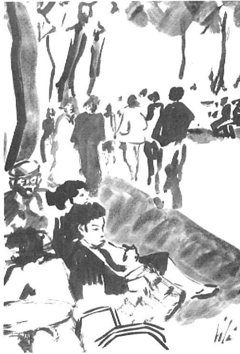
La Rambla de Figueres en un dibuix a la tinta de Felip Vilà.

El caracteritzava la bohèmia, el bon humor, les febleses del bon vivant , de l'aventurer que assumia el fet de viure amb la contundència del que treballa perquè espera beneficiar-se de la collita en temps de la recollecció, com ho solen fer els veïns de Ceret a l'hora d'aplegar les cireres. Aquelles cireres d'un vermell explosiu que tant fascinaven Salvador Dalí. Felip Vilà, quan n'era el temps n'hi solia portar un cistell, i el «geni» amb dits trèmuls n'agafava algun per assaborir-ne la dolçor.