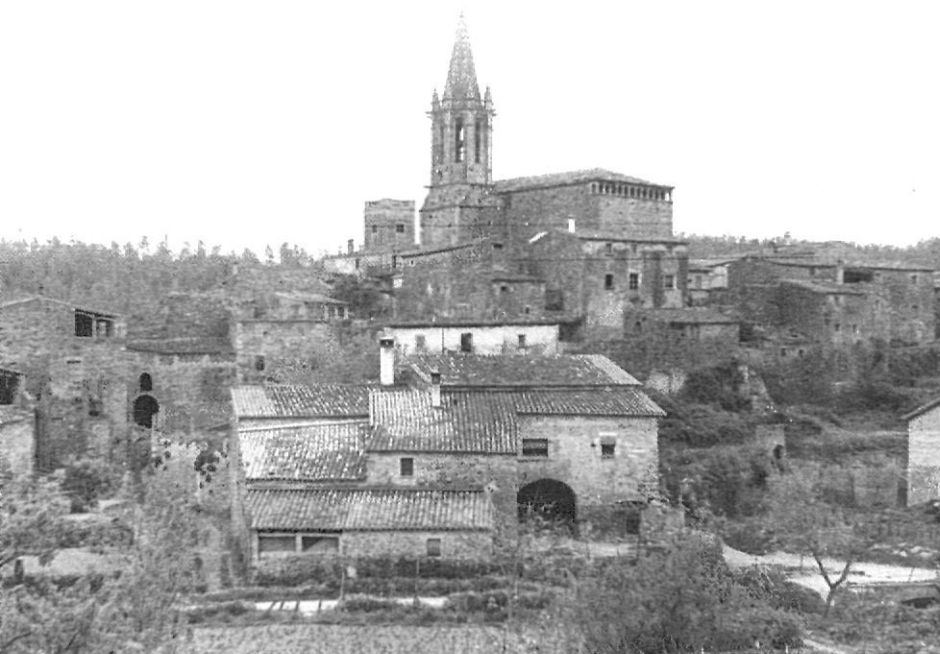
«Sant Martí Vell i Madremanya, carregats d'història, amb nuclis petits i carrers impensables».