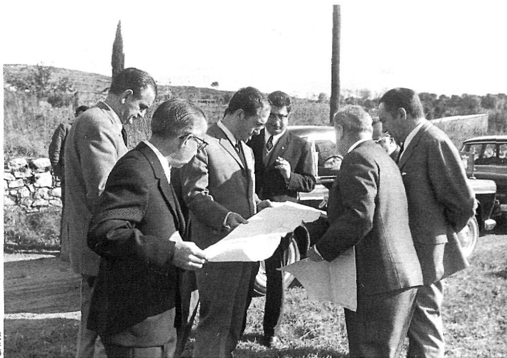
Autoritats acadèmiques i polítiques examinen plànols i possibles terrenys per a la Universitat de Girona.

Eren molts els pessimistes. Un argument en contra era el fet real que en tota