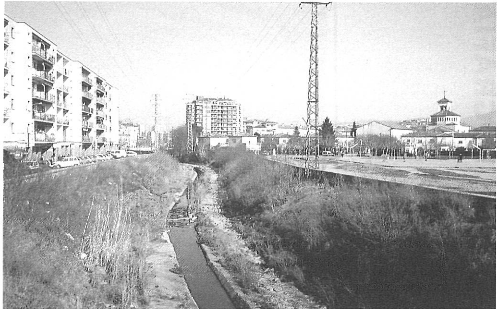
El llit del Güell. A la dreta, el grup Sant Narcís.

neix a Aiguaviva del Gironès, és un riu amb un recorregut molt curt. La superfície de la seva conca és aproximadament de 26,72 km 2 , la seva longitud és de 13,5 km i més del 50% de la seva conca té una altura mitjana de 150 m sobre el nivell del mar.