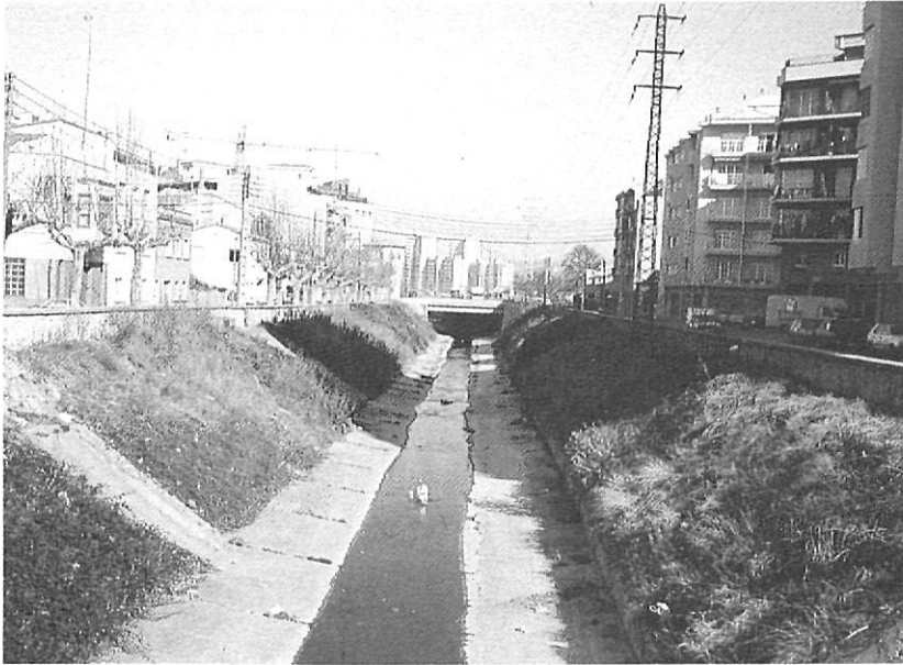
La canalització actual del Güell.

ment consolidat, la zona d'eixample de postguerra s'anirà urbanitzant molt lentament (fins al 1969 l'Ajuntament no fa l'encintat), i la urbanització definitiva no va fer-se fins al 1977).