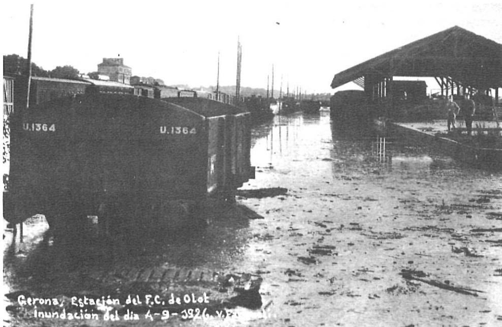
Girona, Estación del F.C. de Olot inundación del día 4-9-32 (v. 2)

Arribem a l'aiguat de l'11 d'octubre i matinada del 12 de 1970. La riera Massana i el riu Güell inunden la carretera de Barcelona, els terrenys de les vies del tren, el barri de Sant Narcís, el carrer Nou i el carrer de St. Francesc i van a parar finalment al llit de l'Onyar. Morfològicament, als inicis de la dècada dels 70, el procés d'ocupació del sòl s'havia estès a ambdues ribes del Güell. El 1967 comencen a construir-se els blocs de can Givert del Pla, Sant Narcís feia temps que estava plena-