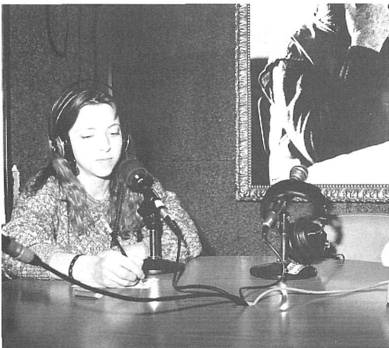
Després d'uns anys d'activitat intensa, Ràdio Salt ha entrat en crisi per problemes amb la Societat d'Autors d'Espanya.