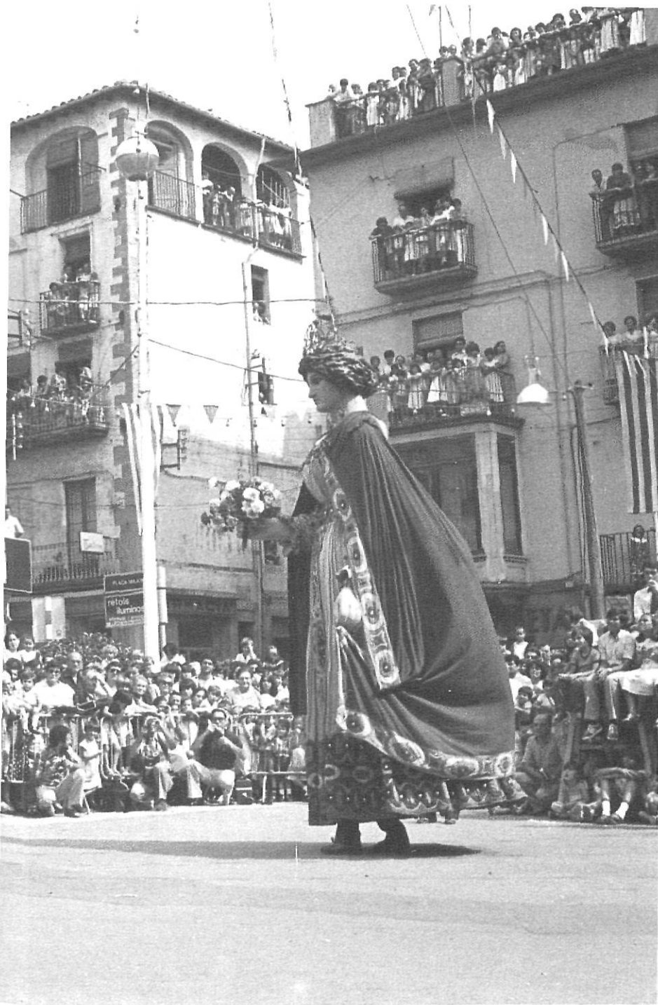
Els Gegants s'han vist envoltats sempre del fervor popular.