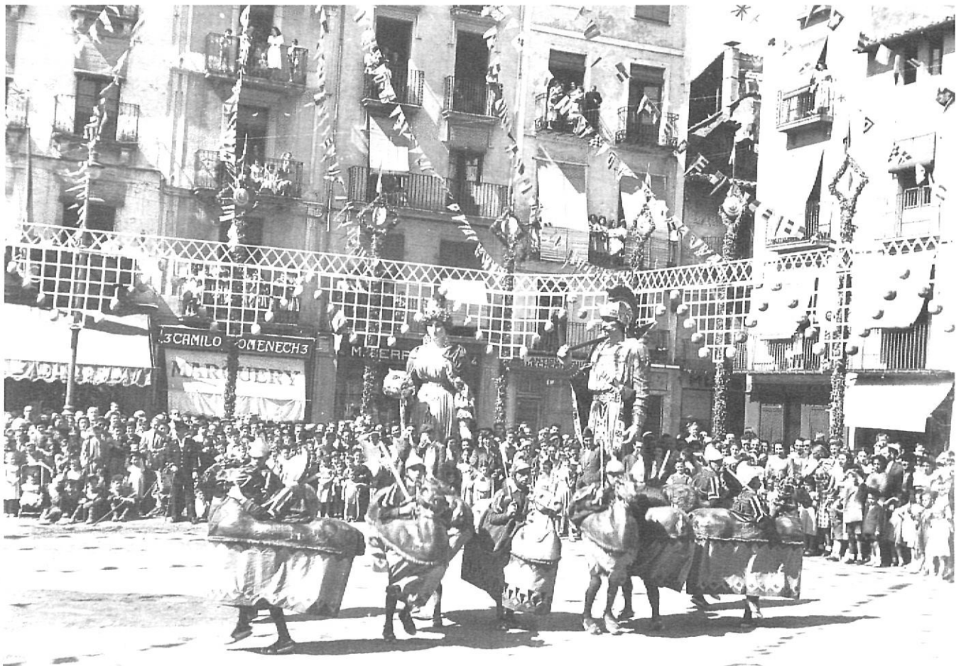
Passen els anys, però els gegants i els cavallets sempre són a la plaça per les Festes del Tura.