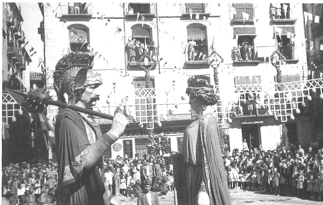
Els gegants constitueixen un dels símbols d'identificació d'Olot.

de caràcter extraordinari, amb motiu d'haver infantat l'esposa del rei Felip II, Margarida d'Àustria. A aquest acte se li donà una pompa semblant al del mes d'agost i, per tant, de segur que hi participà el gegant i altres figures folklòriques de què disposava Olot.